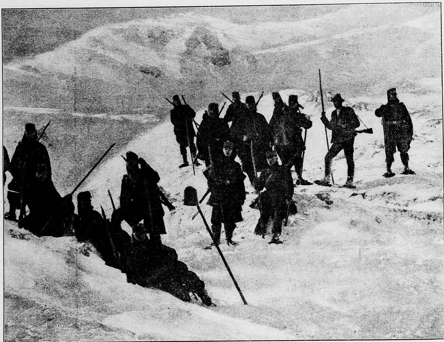
Naše čaty v Karpátoch.

vej posície, o desať minút zmiznú v zemi ako krtice. Naši vojaci sa prirodzene už naučili to isté. Neradi to robili, ale museli to urobiť. Ale tomuto zakopávaniu sa bude dnes zajtra koniec, akonáhle príde zima a zem na tvrdo zamrzne. Toto je tá výhoda, ktorú nám zimná vojna voči Rusom zabezpečí. Keď sa raz Rusi nebudú vedieť zakopať do zeme, veľmi zle sa im povedie. Toto už aj teraz môžno vidieť. Keď sa bez