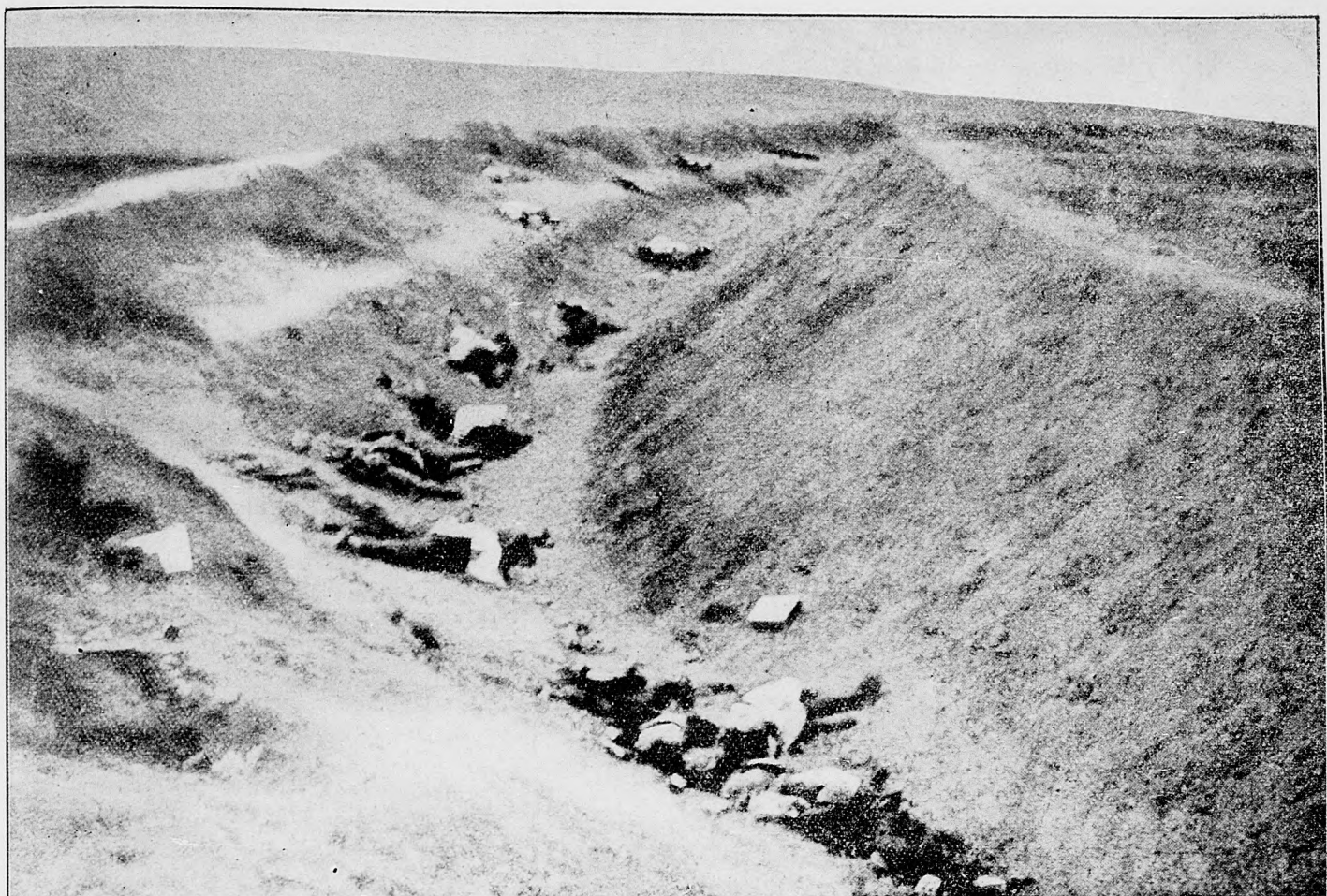
Mrtvoly ruských vojakov v karpátskych priesmykoch.