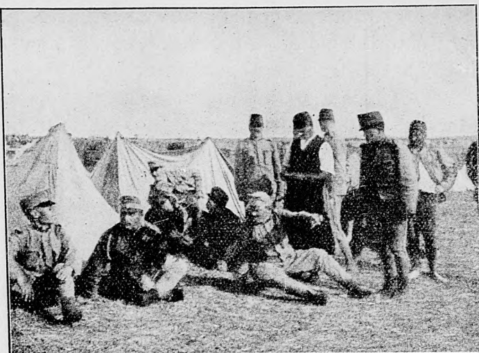
Cigán bakančoš po bitke na huslách hrá v tábore.

«Berliner Tagblatt» rozvinujúc strategické polozenie v Poľsku, hovorí, že v bojoch, ktoré sa vedú teraz v Poľsku, zrejme vysvitá spoluúčinkovanie rakúsko-uhorskej armády, ktorá znova dokázala svoju nezlomnú bojovnú silu. Netrpí pochybnosti, že Rakúsko-Uhorsko pri svojom odpore, vyvinutom voči ruským útokom, vždy všeobecné polozenie drží pred očima a nepúšťa sa ináč do žiadnej bočnej operácie na vlastnom území, nerozdružuje svoju silu a od týchto ohľadov sa neodchýli, keď je o tom reč, že jednotnou akciou treba