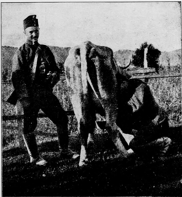
Z haličského bojišta: Pomož si a aj Boh ti pomože.

«Budapesti Tudósító» oznamuje: Aj dotiaľ, kým by sme podrobnejšiu zprávu mohli podať o bojoch vedených okolo jednotlivých priesmykoch v Karpátoch, môžeme ustáliť, že úplné porazenie a vyhnanie z územia krajiny do Zemplénskej vtrhnuvšieho nepriateľa zdarne napreduje. Od Zemplénskej na východ len kde-tu byly menšie, ale všade zdarné boje s nepriateľom stojacim za hranicami krajiny. Jedon silnejší ruský vojenský stlp obsadil severovýchdonú pohraničnú časť stolice šarišskej. Ku zpät zahnaníu tejto skupiny potrebné poriadky byly porobené. Na vidiekoch ležiacich v blízkosti zemplénskych a šarišských vojenských operácií z vojenskej strany po-