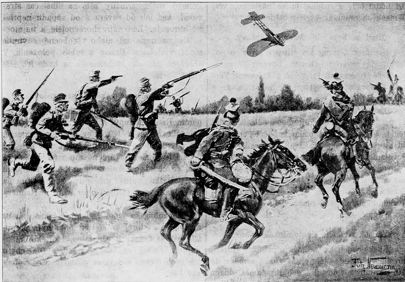
Prenasledovanie nepriateľského lietadla.

meckých zbraní a keď ešte nemožno posúdiť celý význam tohto zdaru, predsa toto víťazstvo bude mať vplyv na válečné operácie v Poľsku a predovšetkým na to, že tlak na Krakov zmierni. Toľto víťazstvo mocnosti trojdohody akiste privedie do zmätku. Francúzsky generalissimus Joffre zaiste inakšie chýry očakával z východu. Že aký účinok bude mať tento nový obrat na válečné operácie na západnom bojišti, ešte nemožno predvídať.