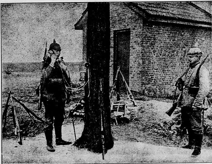
Predstráž v telefonnom spojení s veliteľstvom.