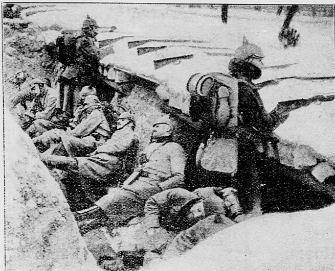
Odpočívanie v strelných járkoch.

Sofia, 18. decembra. «Kambana» porážku Rusov pri Visle vyhlasuje za takú vojensku katastrofu, ktorá sa rovná katastrofe Rusov pri Mazurských jazerách. Nemci — hovorí časopis — tu bojovali takou hrdinskosťou, na akú niet