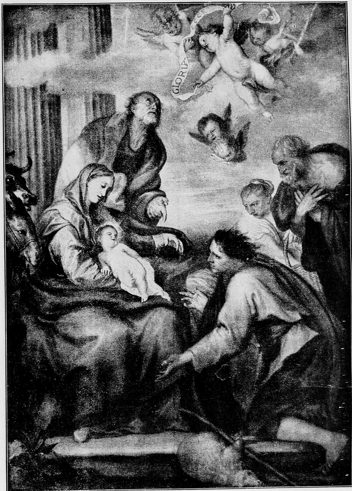
Sláva Bohu na výsosti.