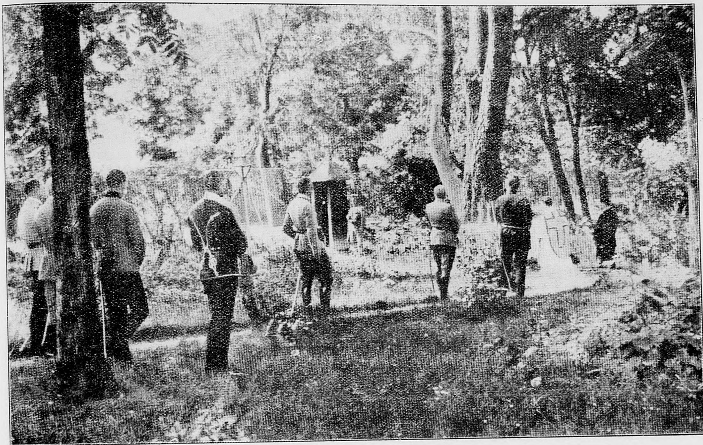
Táborská sv. omša pred Przemyslom.