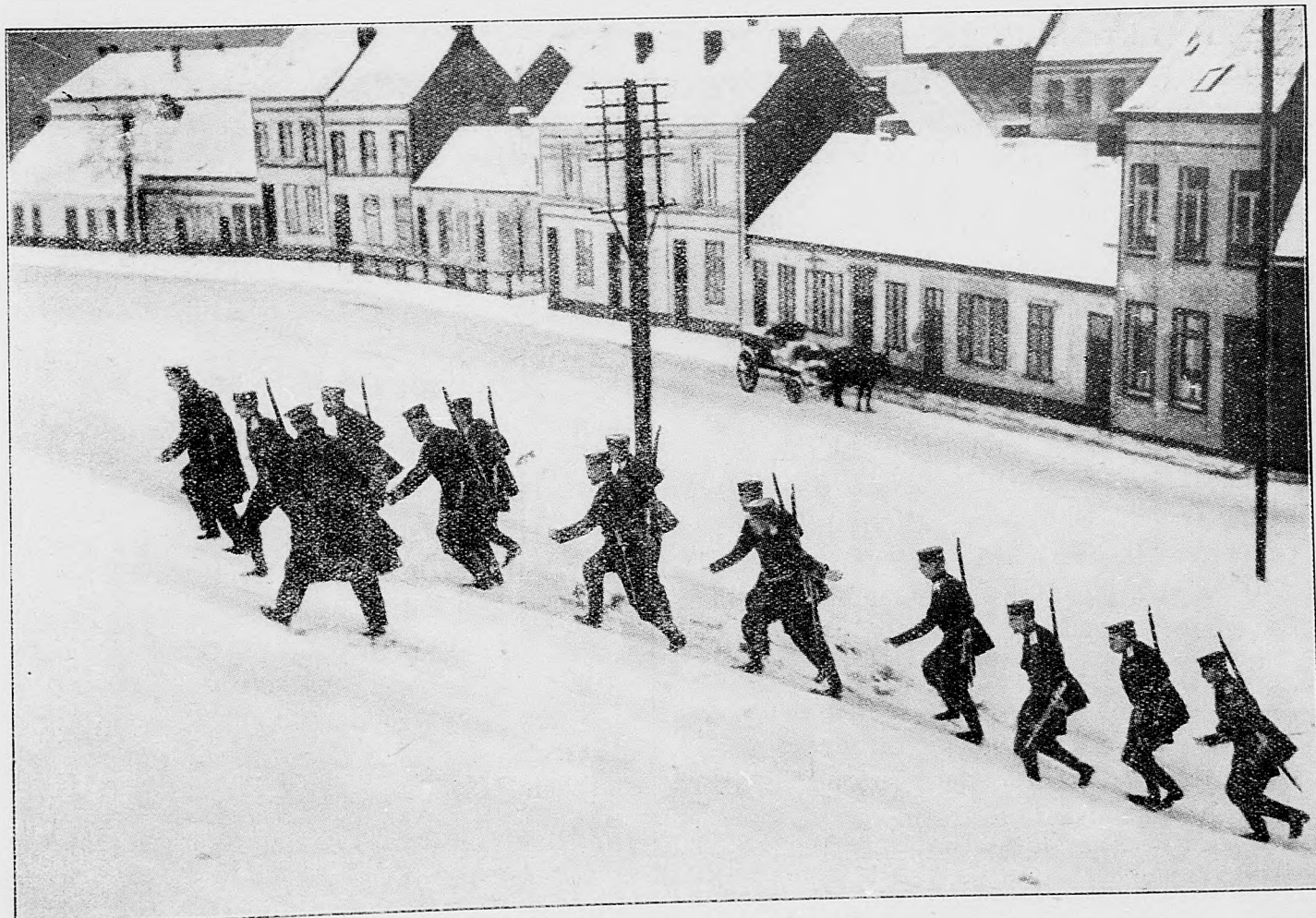
Nemecká predstráž v jednom meste Flandrie.