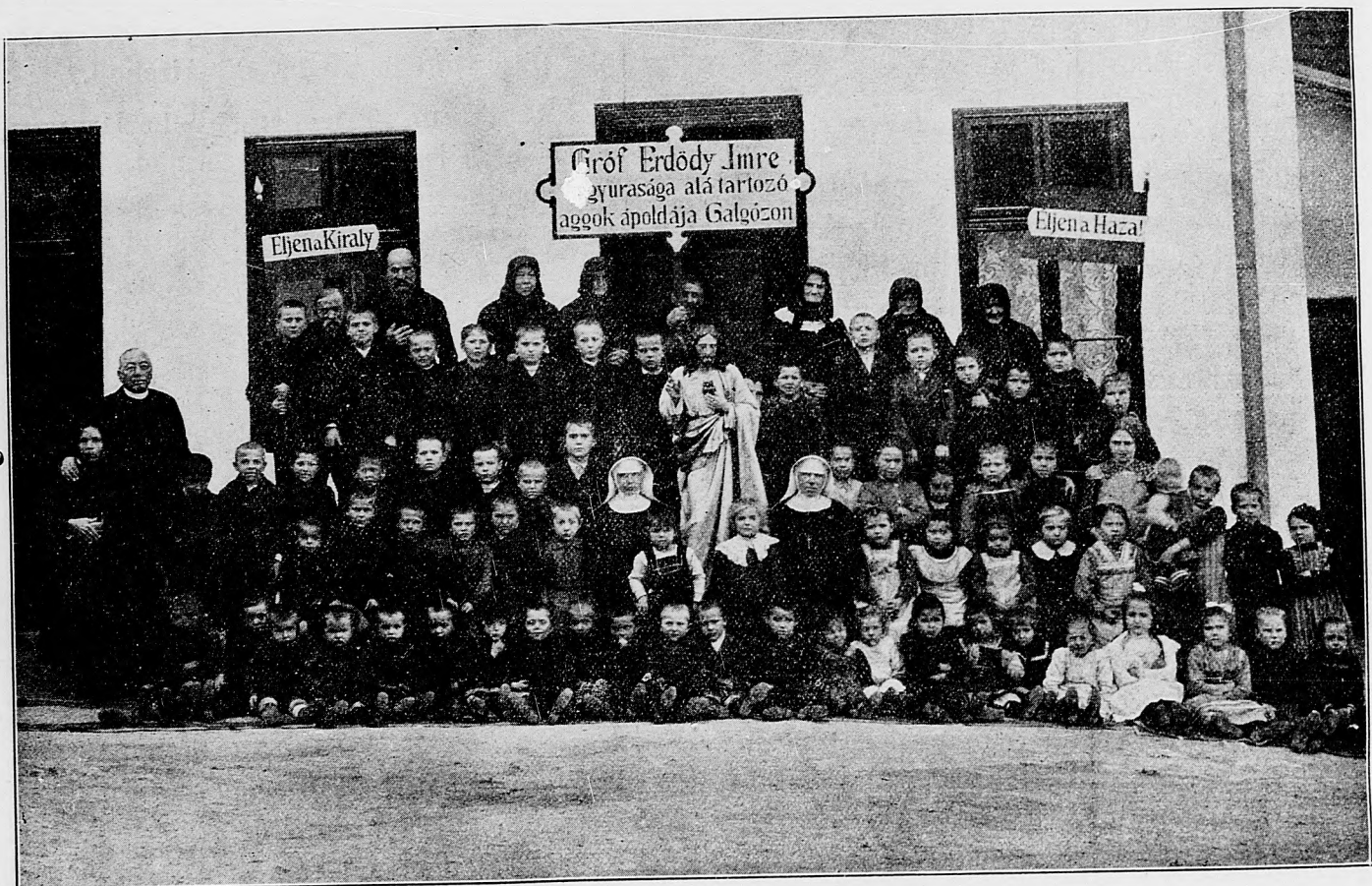
Deti na bojište narukovaných frašackých vojakov.

Genf, 2. januára. Časopisu «Echo de Paris» oznamujú z Tiflisa: Okolo Erzeruma stojí dvestotisíc hláv počítujúca turecká armáda. Rusi sa pokúsili útočiť, ale ich pokus sa tak nešťastne skončil pre nich, že turecká armáda obkolesila ľavé krídle Rusov, následkom čoho Rusi prinútení boli vypratať sa z Urmie.