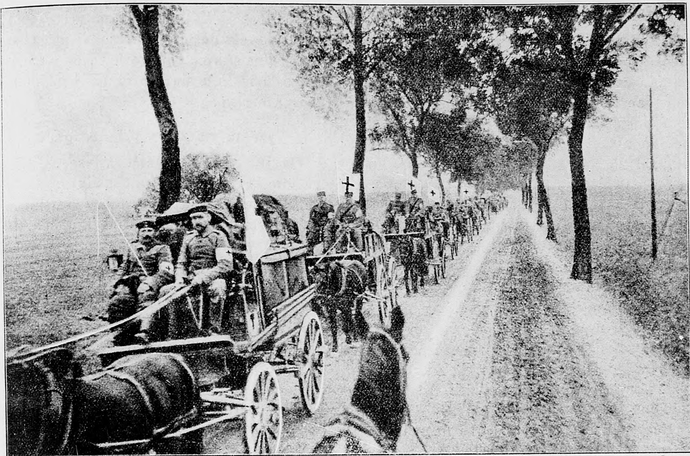
Odvážanie nemeckých ranených.