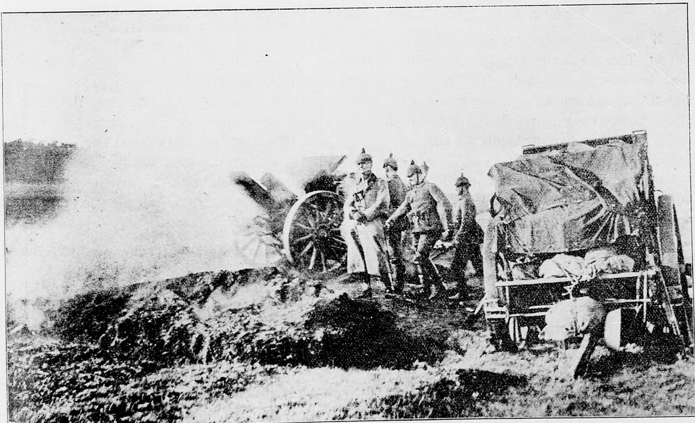
Nemecké ťažké delostrelectvo vo víťaznom boji pri Łodzi.