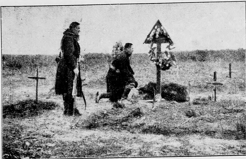
Posledné lúčenie na bojišti.