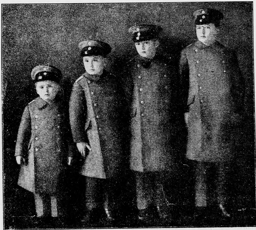
Synovia nemeckého dediča trónu.

Kopenhága, 9. januára. Zprávy petrohradských časopisov z bojišťa, ktoré patrne pochádzajú z úradneho prameňa, oznamujú, že dňa 3. januára armáda Hindenburga viedla živý delostrelecký boj s Rusmi. V tento deň Nemci nie útokami, lež mažiarmi sa usilovali vyhnať Rusov z ich posícií. Ruské časopisy prinášajú ďaleko siahajúce kombinácie, nesmyselné tvrdenie ruského generálneho štábu ale, že Nemci pozdlž rieky Bzury pracujú aj so 42 centimetrovými mažiarmi, bez poznámky uverejňujú.