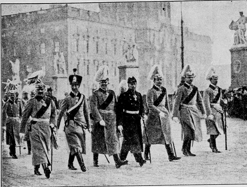
Nemecký cisár a jeho šesť synov.