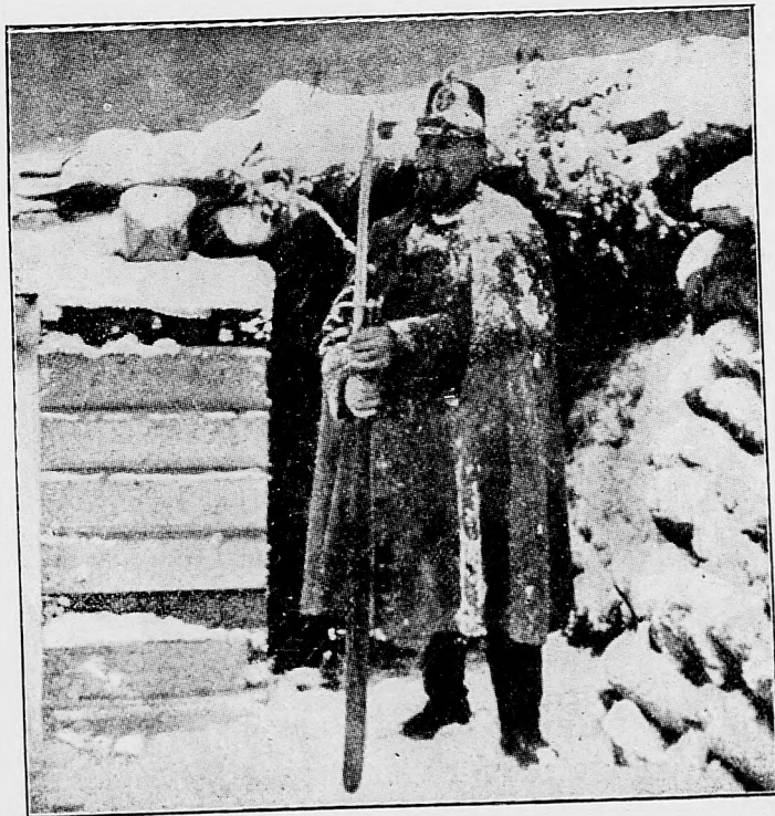
Predstráž vo fujavici.

Berlin, 12. januára. «Kreuzzeitung» píše: Napredovanie Nemcov ku Varšave boje svedené pozdlž štyroch riek, Bzury, Ravky, Suchej a Pilice napomáhajú. Rusi tu nevedia pristaviť naše víťazné postupovanie. Počiatkom tohto roku naša armáda zaujatím silného ruského oporného bodu Borzymova veľmi značne postúpila. Zaujatie tohto oporného bodu bolo preto veľavýznamné, lebo týmto padla jedna z tých pevných posícií, ktorými Rusi chcú kryť Varšavu. Borzymov je medzi Lovičom a Šochačevom od Ravky na východ, teda ku Varšave v rovnom východnom smere. Rusi tu síce vyvinujú húževnatý odpor, ale nemôžu odolať našim čatám. Aj napriek zlému počasiu zo dňa na deň oznamujú nový zdar našich, ktorých úspechy zvlášte pri prvých troch riekach sú veľké. Ponevác následkom zdaru pri Bolimove odsek Ravky dostal sa do našich rúk, útocienia našej armády na čiare Šochačev—Varšava značne pokročily. Dňa 6.