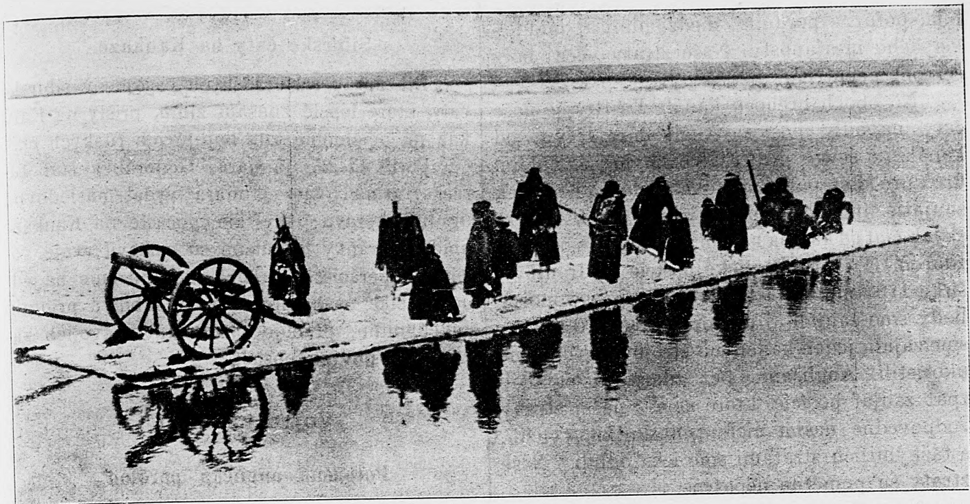
Ruské válečné klamstvo k vyskúmaniu nemeckého delostrelectva na rieke Memel. Nemci však nedali sa oklamať a rozstrelali nielen slamených ruských vojakov, lež zaujali aj nepriateľské pozície.