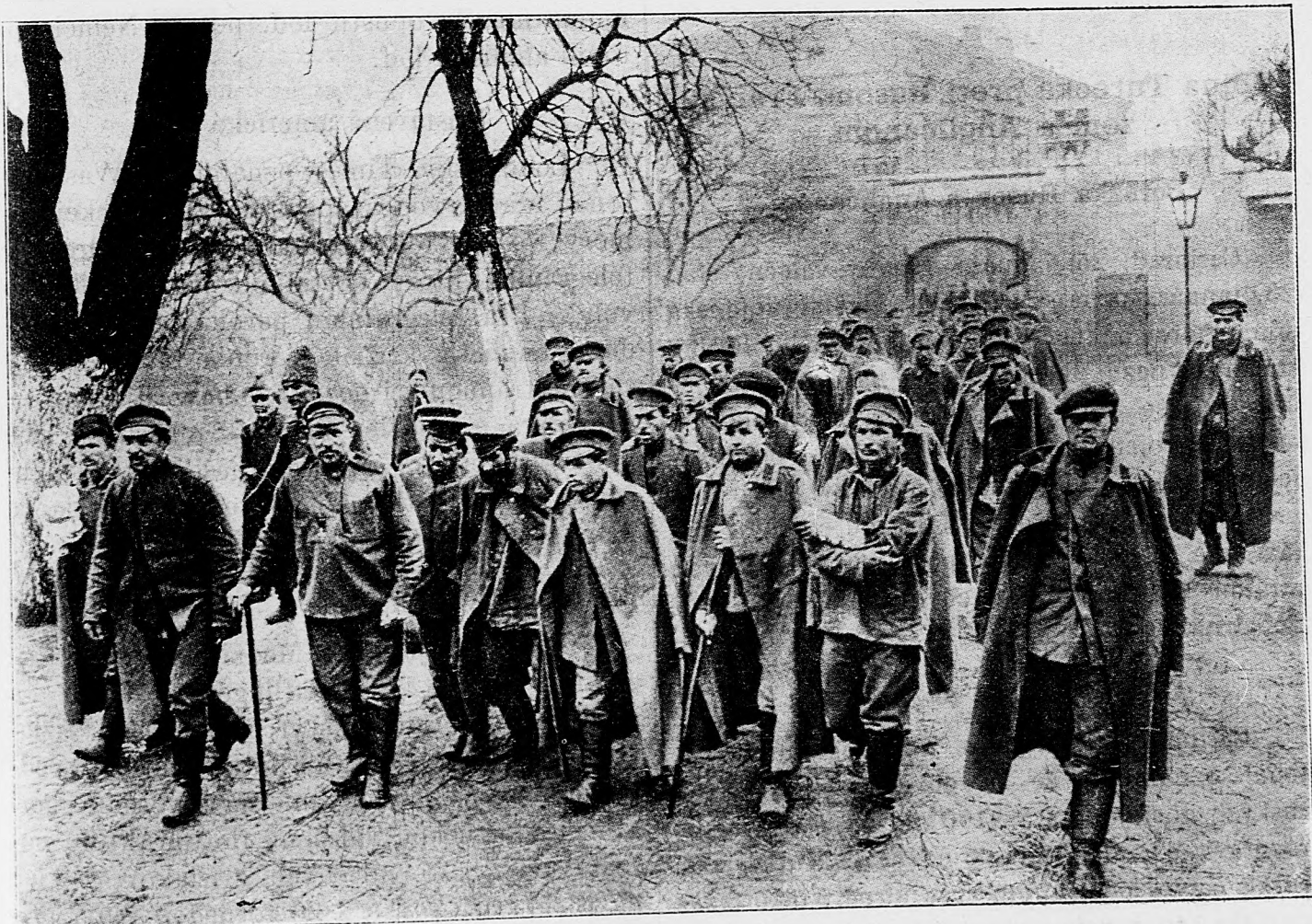
Ranení ruskí zajatci v nemeckej nemocnici.