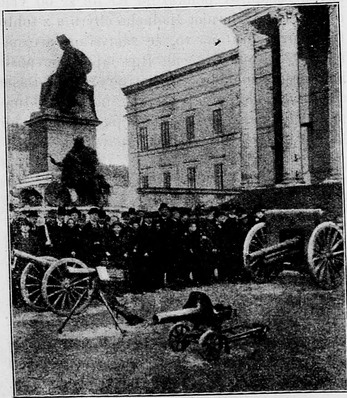
Ukorenštené ruské kanóny pred sochou Jána Arany v Budapešti.

Útok Francúzov proti nám od Verduna na sever sme ľahko odrazili.