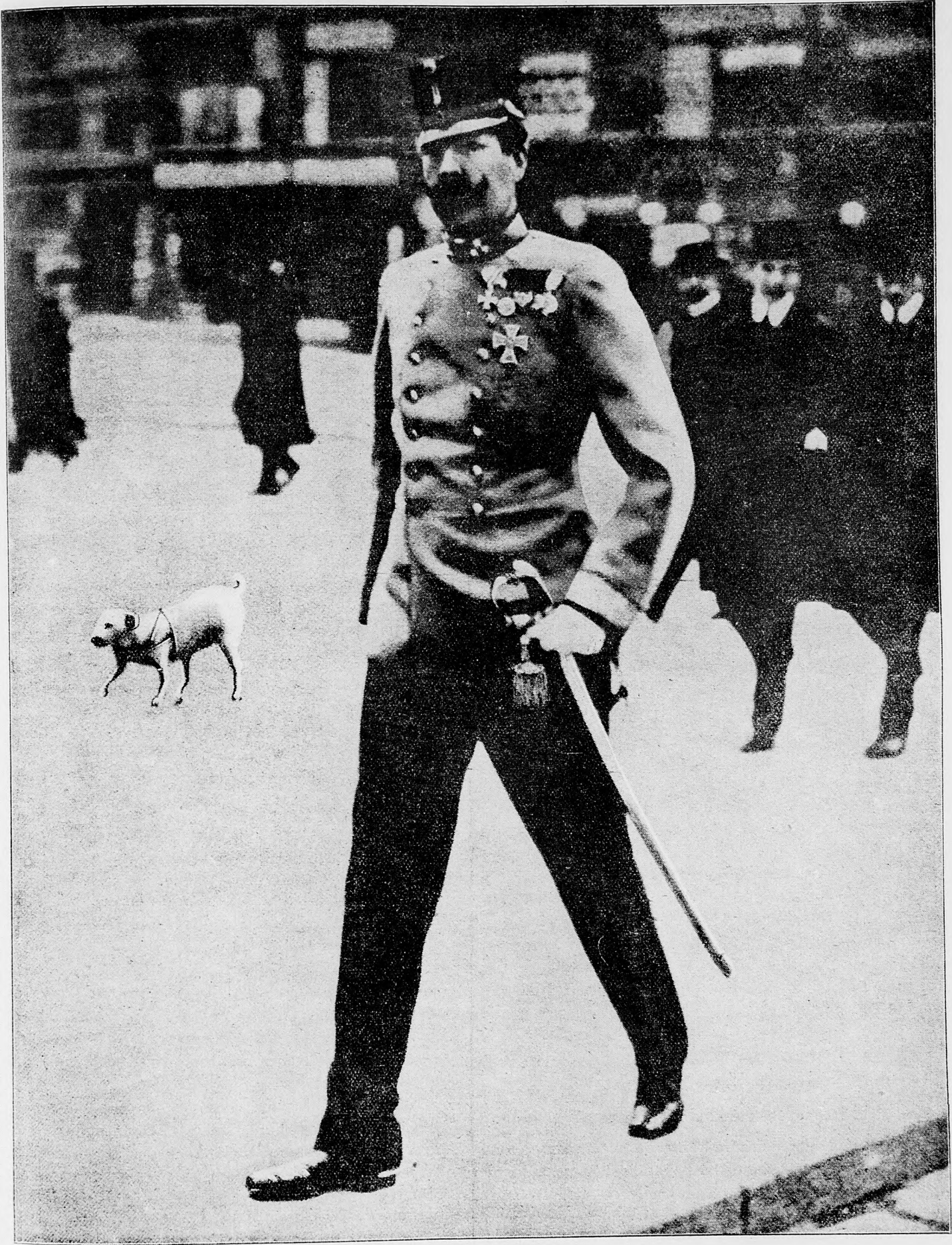
Arciknieža Eugen, hlavný veliteľ južnej armády.