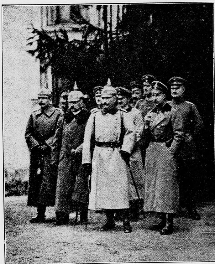
Nemecký hlavný válečný stán na čele s nemeckým cisárom.

V Champagne aj včera bolo pomerne ticho. Počet v posledných bojoch nami tam zajatých zvýšil sa na 15 dôstojníkov a ny vyše 1000 chlapov. Krvavá ztrata nepriateľa dokázala sa mimoriadne veľkou.