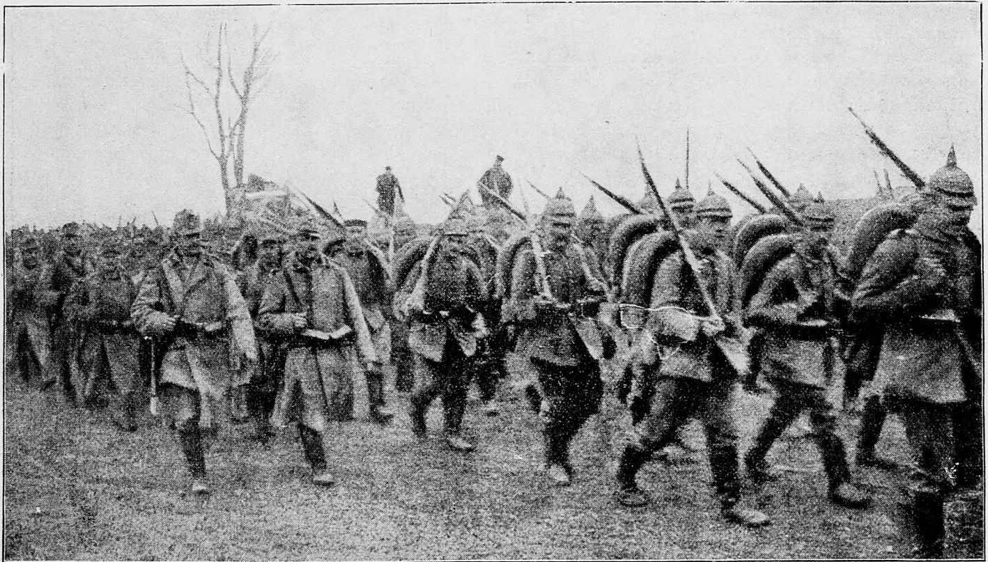
Uhorské a nemecké čaty spolu maširujú v Karpátoch.