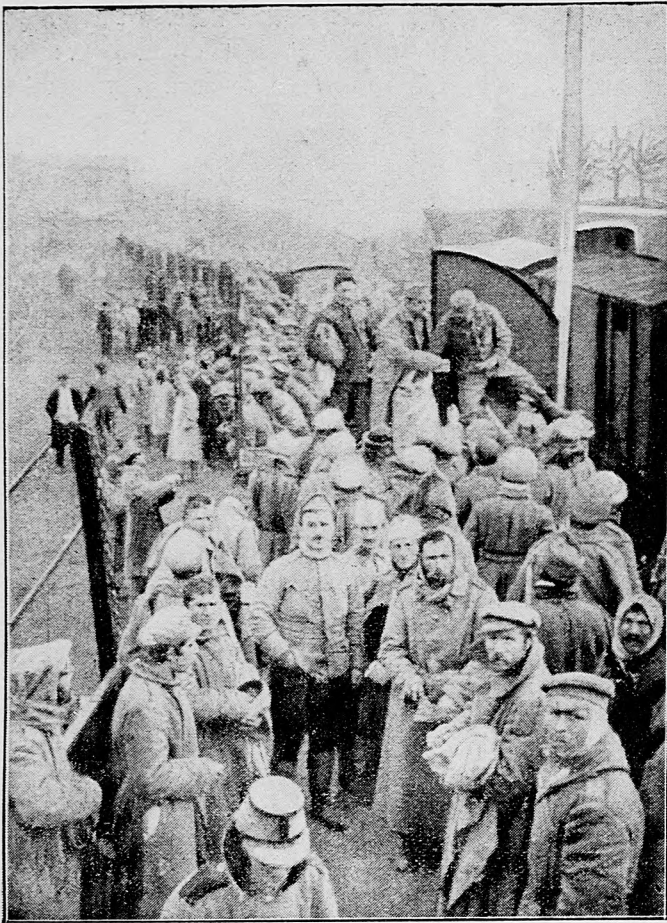
Prevážanie ruských zajatcov.

meraných dekungov bojujú jedna proti druhej. Ešte i ťažké batterie ťažko možno skryť pred nepriateľom. Obidve poznámky, tak sa zdá, chcú pripraviť verejnú mienku, že tak pri Ošovieci, jako i pri Prasnyši možno očakávať víťazstvo Nemcov.