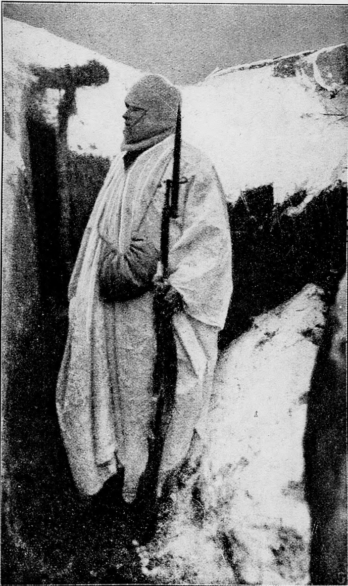
Honvédska predstráž v snahovom plášti.

Z úbočia ležiaceho od Argonnu na východ od Vauguisa na severozápad Francúzov, ktorí sa tam priechodne boli zahniezdili, zpät sme odbili.