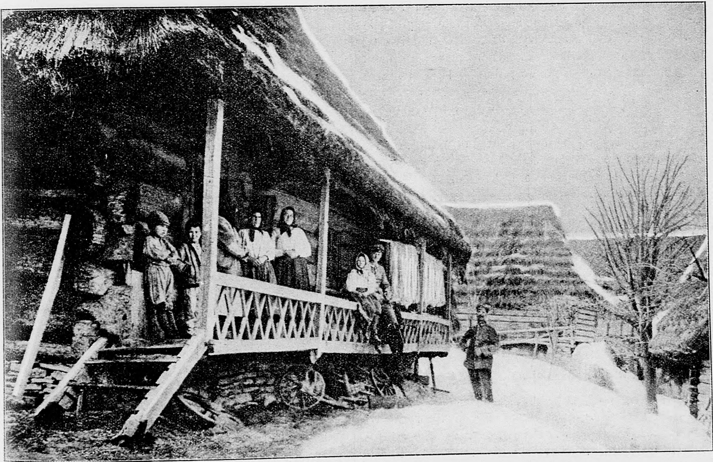
Z karpátskeho bojišťa. Ubytovanie v rusinskom dome.