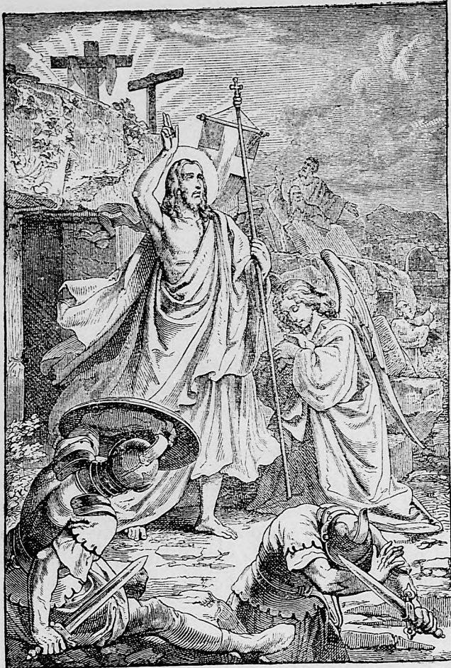
Kristus Pán vystupuje z hrobu.