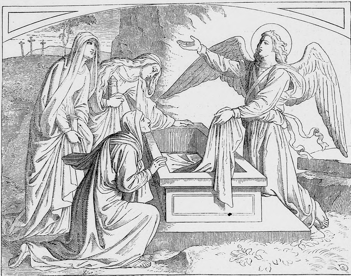
Sväté ženy pred prázdny hrobom Krista Pána.

Montmartre, bol udajne benzin. V nedeľu rano mladí i starí hľadali trosky bomb na tých uliciach, nad ktorými letely vzducholode. Prvý chýr o blížení sa Zeppelinovských vzducholodí prišiel z Compiègne okolo 1. hod. v noci. Na uliciach pozahášali lampy a trúbami dali na vedomie, aby ľudia ušli do pivníc, lebo sa blížia nepriateľské lietadlá. V predmestiach Asniéresu a Le Valois niekoľko letohrádkov vyšlo na zkažu a viac ľudí bolo ranené. Na Zeppelinovské vzducholode strieľali najprv z najkrajnejšej parížskej pevnosti Poissy, ale celkom bezvýsledne.