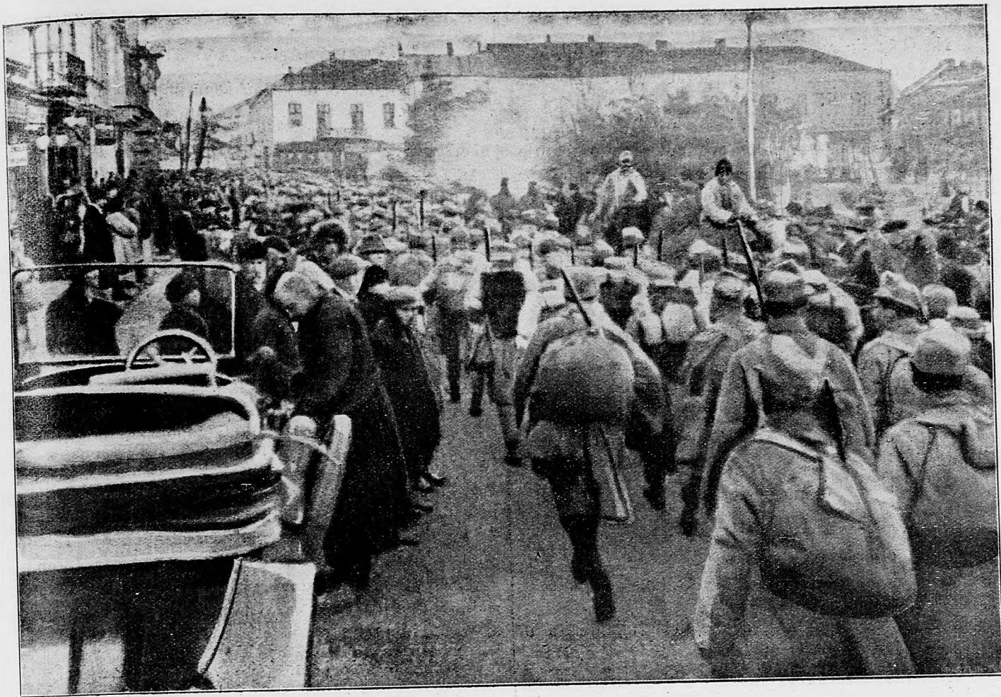
2 Vtiahnutie našich čiat do Kolomei v Bukovine.