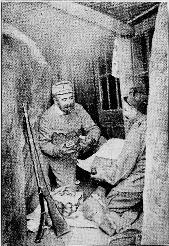
Pánu nadporučíkovi v zákope, kde má celkom zariadené bydllo, doručili balík z domu.

Amsterdam, 15. apríla. Londýnsky «Morningpost» v článku, ktorý budí veľký ruch, píše : Sme v 9. mesiaci ukrutnej vojny. Mnoho tisíc padlo z najlepších mužov Anglicka. Nemci nepopustia ani o krok a my ešte ani takto nedostaneme vojakov. Volačo je u nás nie v poriadku. Ľud zaviedli. Veci im neukázali tak, ako