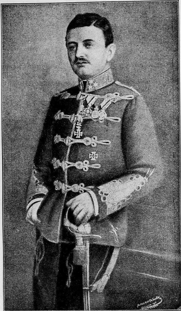
Arciknieža Karol Franc Jozef, následník trónu.

priestoru, ktorý by nebol granátmi poprerývaný. Stromy sú dodrúzané od gúl. Keď delostrelectvo úmŕklo — rozprával jeden očítý svedok — vtedy pechota šialene kričiac hnala sa ku nemeckým strelným zákopám. Tento pekelný krik však skoro umlkol od strašnej palby Nemcov. Z tých, ktorí sa pohli k útoku, len veľmi málo došlo ku nemeckým strelným jarkom, kde potom prišiel rad na neopísateľný ručný boj. V týchto okamženiach o strieľaní nemohlo byť ani len reči, kolbami pušiek a rýľami napadli jeden druhého a spomenutý očítý svedok viackrát videl, ako hlušili Nemci Francúzov holými päsťami a Francúzi hrýzli Nemcov na tvári.