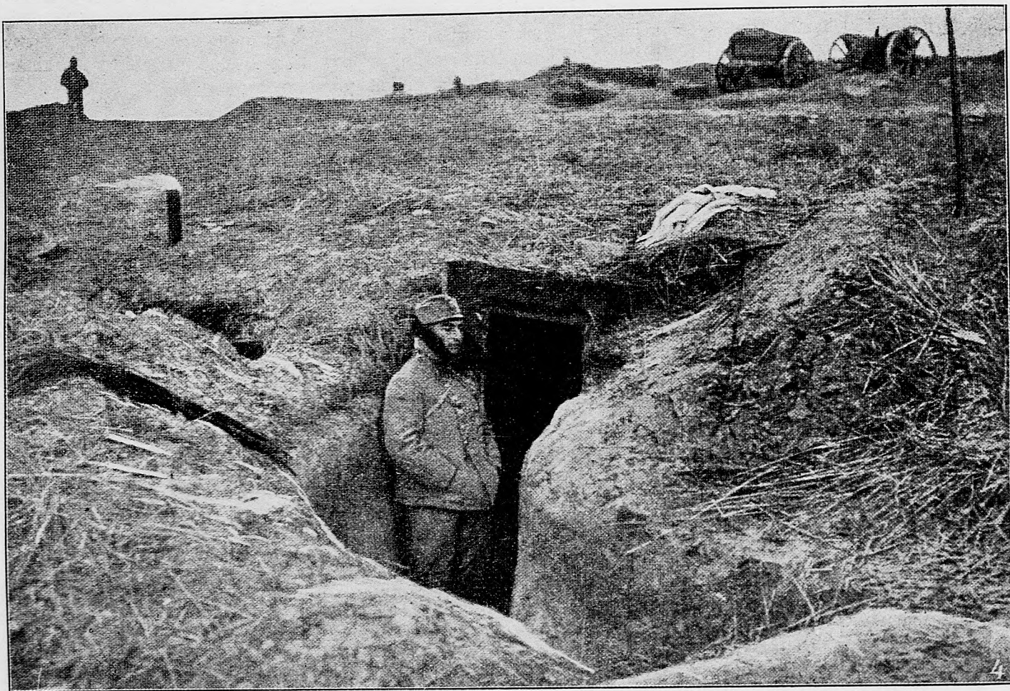
Z bojov v Karpátoch: Jednej batterie telefonová stanica pod zemou.

Posledný silný útok Francúzi začali 4. apríla po-