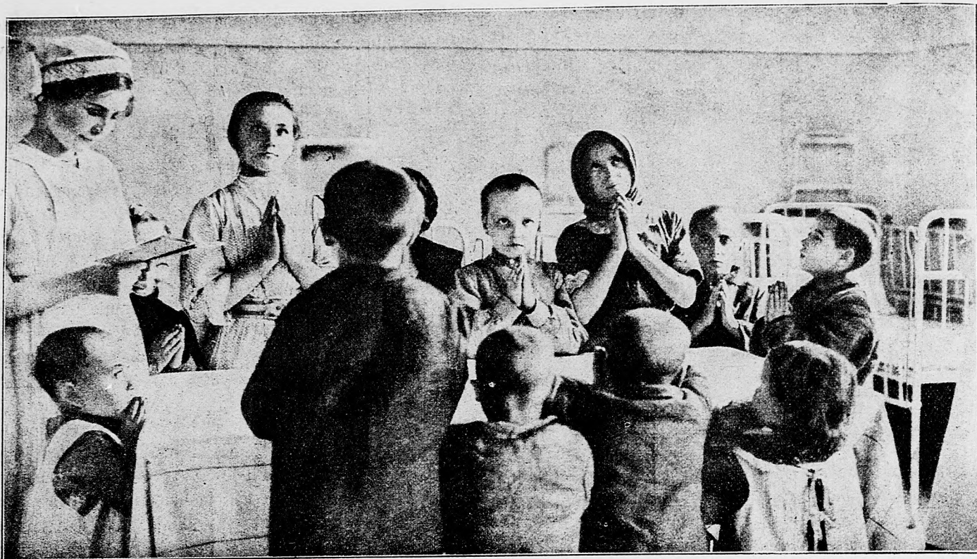
Vojenské siroty v detskej útulni.

Pri Dusisse na okolí Eiragole zas sme odrazili silné nepriateľské útoky. Naše čaty proti ruským silám od Njemena južne napred potisknutým vôbec v smere Gryskolendy, Syntovfy, Saki pohly sa k útoku. Bitka ešte trvá: včera sme zajali 1700 Rusov. Od Vysokej na sever naša jazda odrazila nepriateľskú jazdu. Ruské útoky, urobené proti Mariampolu, sa zmarily.