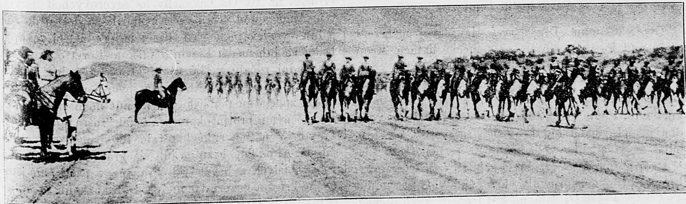
Nemeckí vojaci na dromedároch vo východnej Afrike.

Od Armentiéresu na juh medzi Neuve Chapelle a Givenchy a od výšiny Loretto na sever čiastočné útoky nepriateľa krvave sme odbili. Pri Neuville v streleckej zákope k útoku prichystané čaty nepriateľa pre palbu nášho delostrelectva nemohly sa rozvinúť.