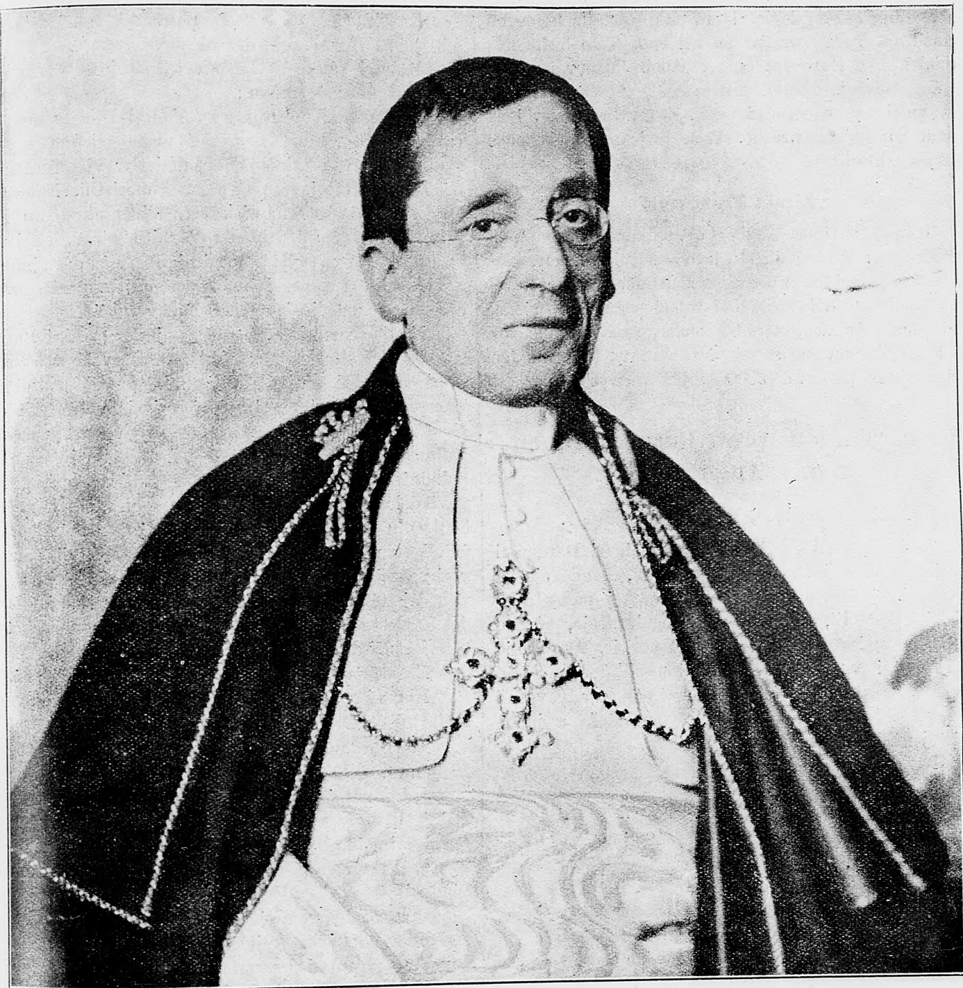
Najnovšia podobizeň svätého Otca Pápeža Benedikta XV.

delostrelectva celý deň trval. Dnes rano okolo 3. hodine prešli sme do protinápadu, naše zákopy sme úplne očistili od nepriateľa, ktorý bol vnikol do nich a zajali sme 150 chlapov. Pri Marcheville jedno malé vytrhnutie nepriateľa ľahkým spôsobom sme odbili. Od Neuville