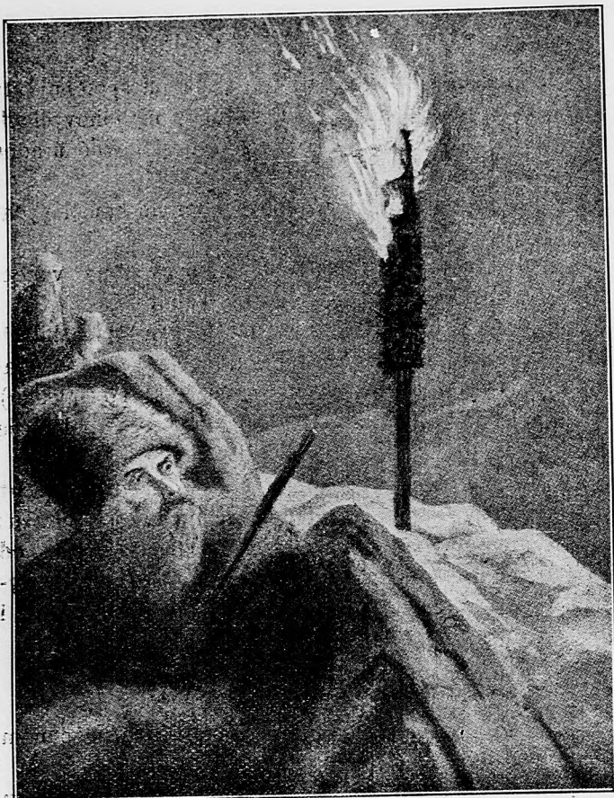
Z tureckého bojišťa: Ruské znaky ohňom na Kaukaze.

O udalostiach východného bojišťa hlavný válečný stán nemecký 20. júna vydal nasledovnú úradnú zprávu: