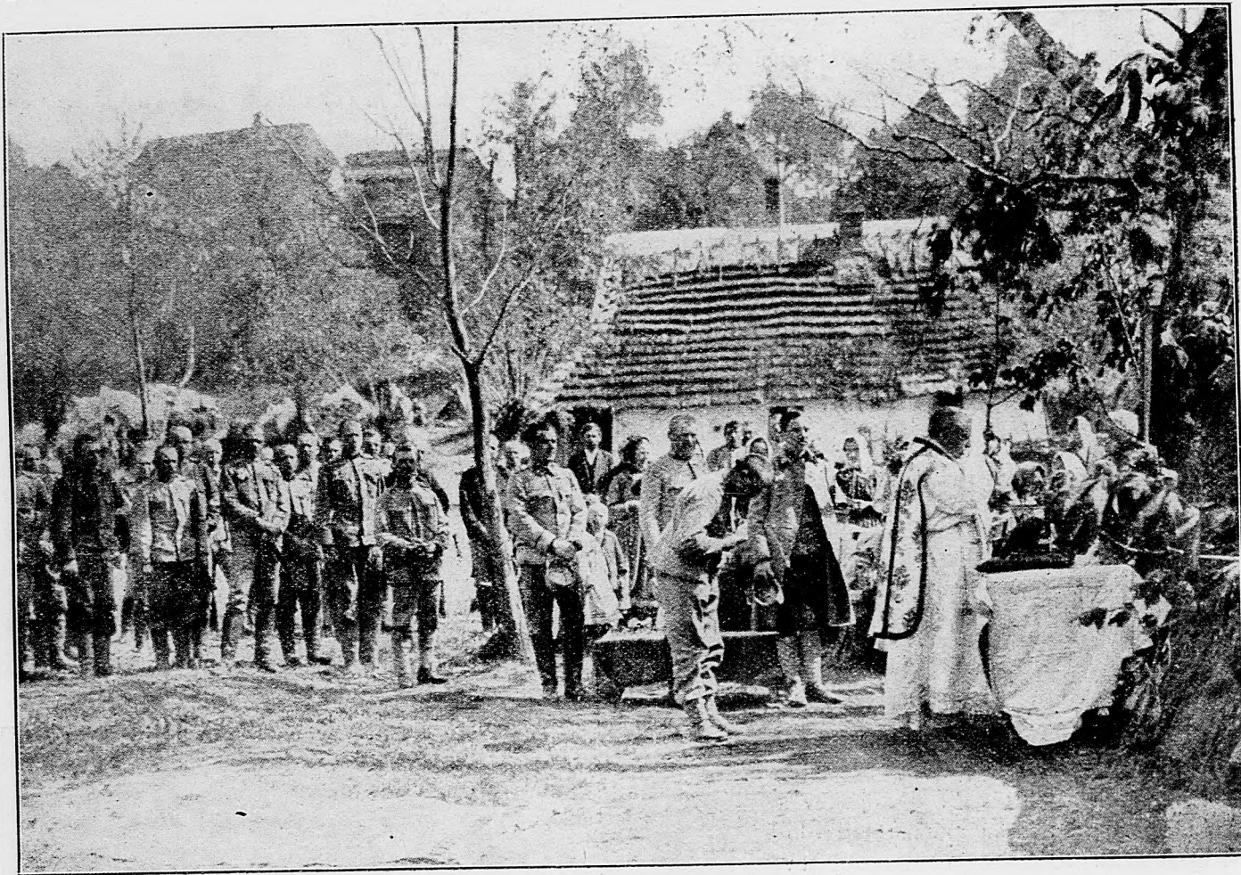
Táborská sv. omša na bojišti vo sviatok Božieho Tela.

Kopenhága, 22. júna Dľa parížskych zpráv boje