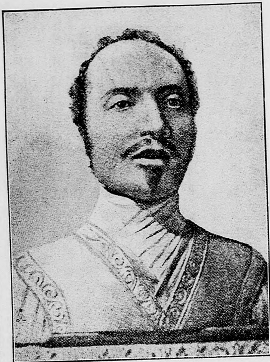
Podobizeň sv. Ignáca v tiháňskom kláštore Benediktínov.

15. júla. Pri Vindave, od Kuršanov nadol, v menších bitkách zajali sme dvoch dôstojníkov a 425 obecných vojakov. Od Njemena južne, na okolí Kalvarje, naše čaty zaujali Franciskovo a Ošovu, taktiež viac ruských predných posícií a podržali ich voči prudkým útokom.