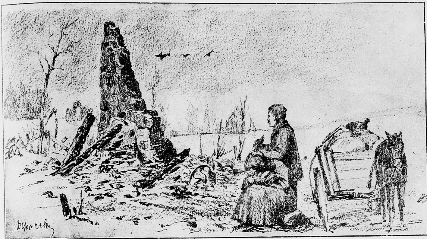
Návrat obyvateľov hornouhorskej dediny po vyprášení Rusov.