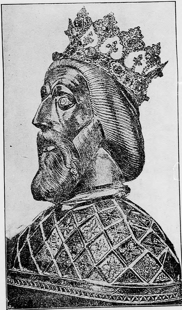
Schraňka pozostatkov sv. Ladislava.

V Champagne od majera Beau-Séjour na severozápad jeden ručnými granátmi urobený nepriateľský nápad následkom palby našich mín nebolo možno previesť.