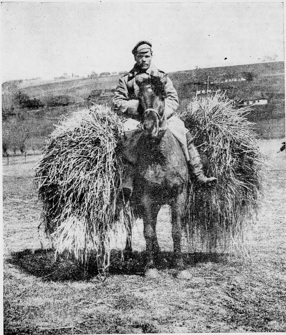
Figel ruského jazdca. — Aby ho z ďaleka nepoznali, obložil sa senom.

29. augusta. Spojenecké čaty včera porazeného nepriateľa zahňaly za čiaru Pomorzany—Koniuchy—Kozowa a za odsek Koropiec.