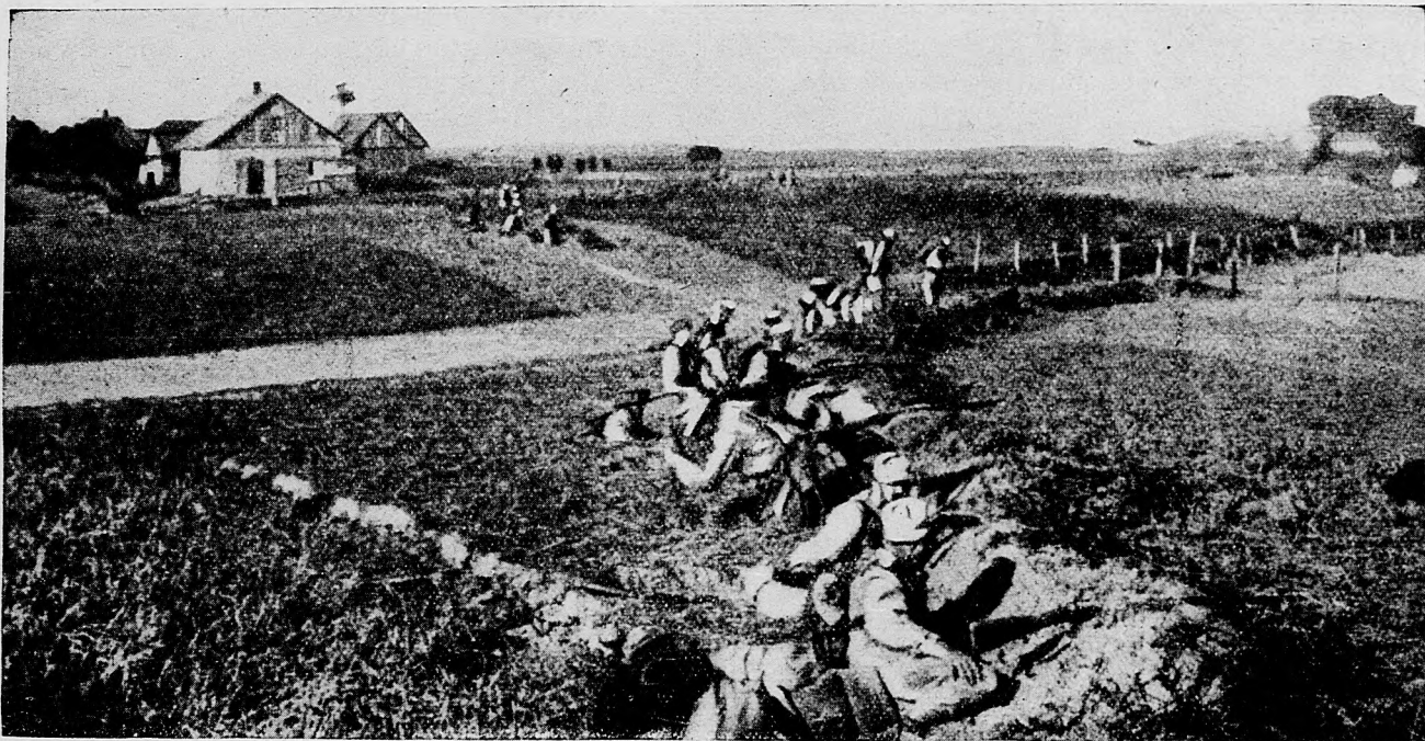
V strelnej zákope pred Ivangorodom.

Ďalej na juh nemecké čaty v smere Njemena napredujú. Priechod na odseku Berezovky, od Ossoviecu na východ, sme vybojovali. Prenasledovanie nepriateľa