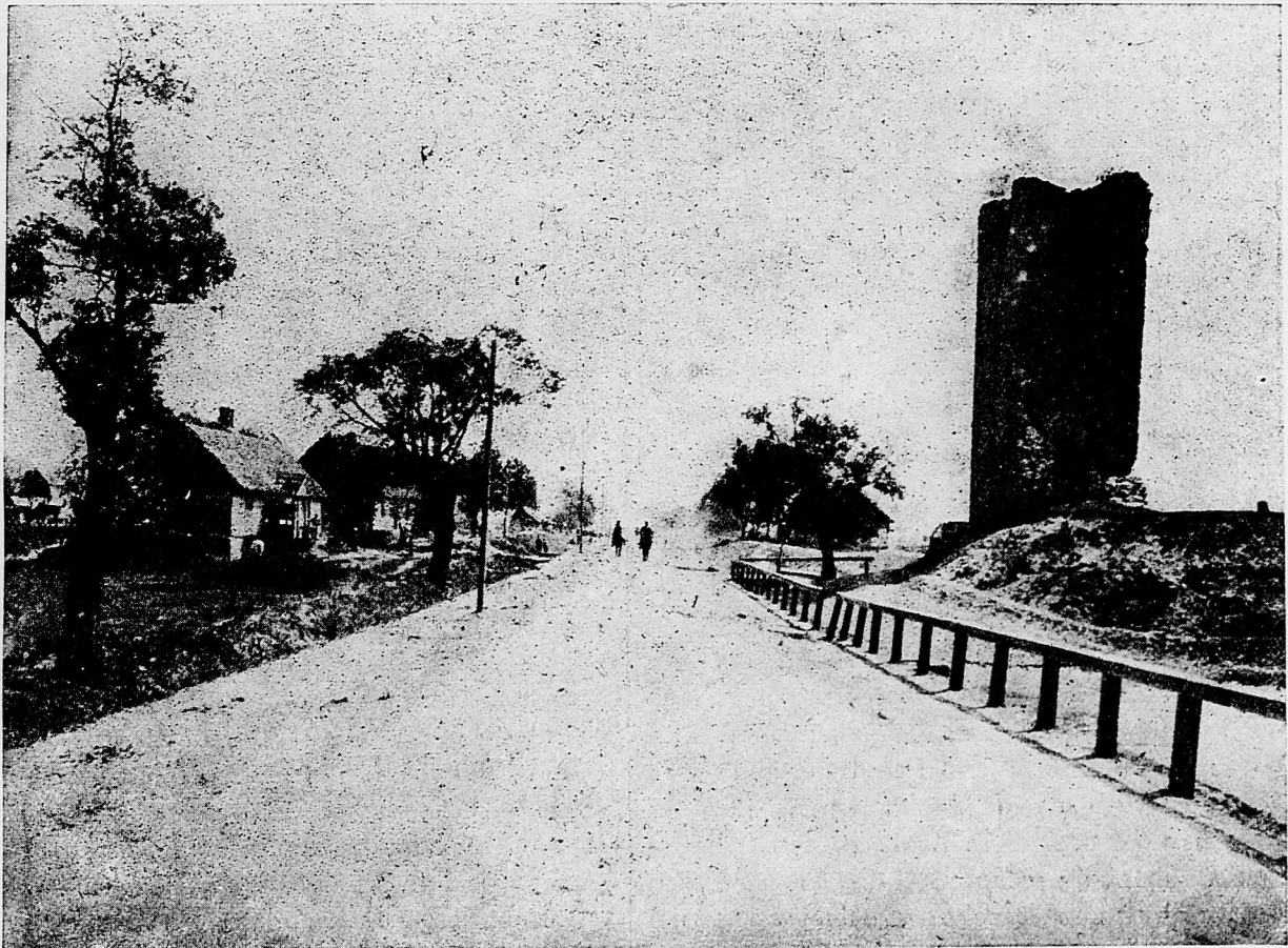
Jazdecká patrola ku hradu Dubno.

Na odseku Sed il Bahru na ľavom krídle nepriateľa rozhodili sme protipodkopu a týmto sme zničili osadu podkopov nepriateľových. Na pravom krídle hádzaním bomb nepriateľa prekazili sme v tom, aby vykopal sem i tam ľahajúce sa strelecké zákopy a zapríčinili sme mu veľké ztraty. Na tomto krídle naše delostrelectvo umlčalo jednu nepriateľskú batteriu.