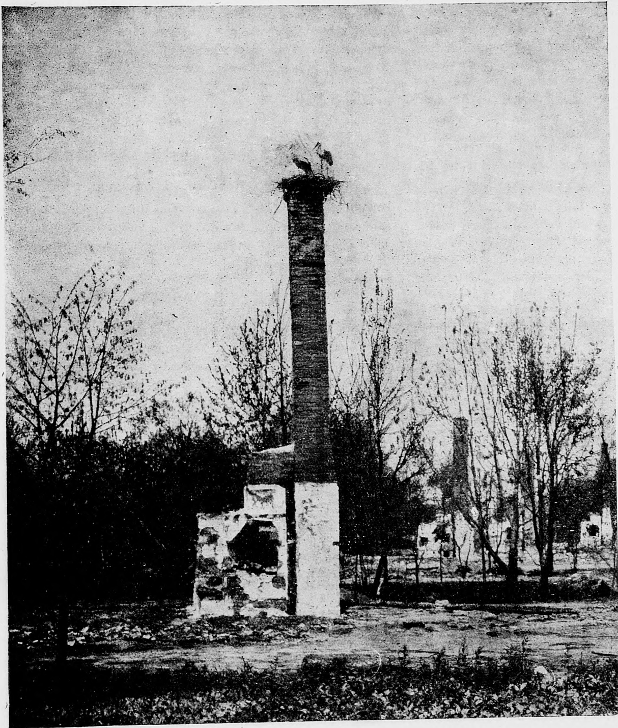
V Ruskom Poľsku. Romy jedného mesta.

Basel, 10. septembra. Dľa parížskych zprávk okol-