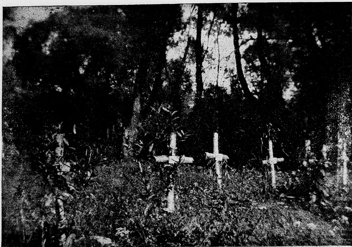
Hroby honvédov v jednej poľskej hore.

Nielen na suchu, lež i v povetrí a od mora bojovali. Francúzsko-anglická kanonáda prevyšovala každú fantáziu. Tisíce a tisíce nábojov bez prestania padalo na nemecké posície z množstva kanónov rôzneho kaliberu.