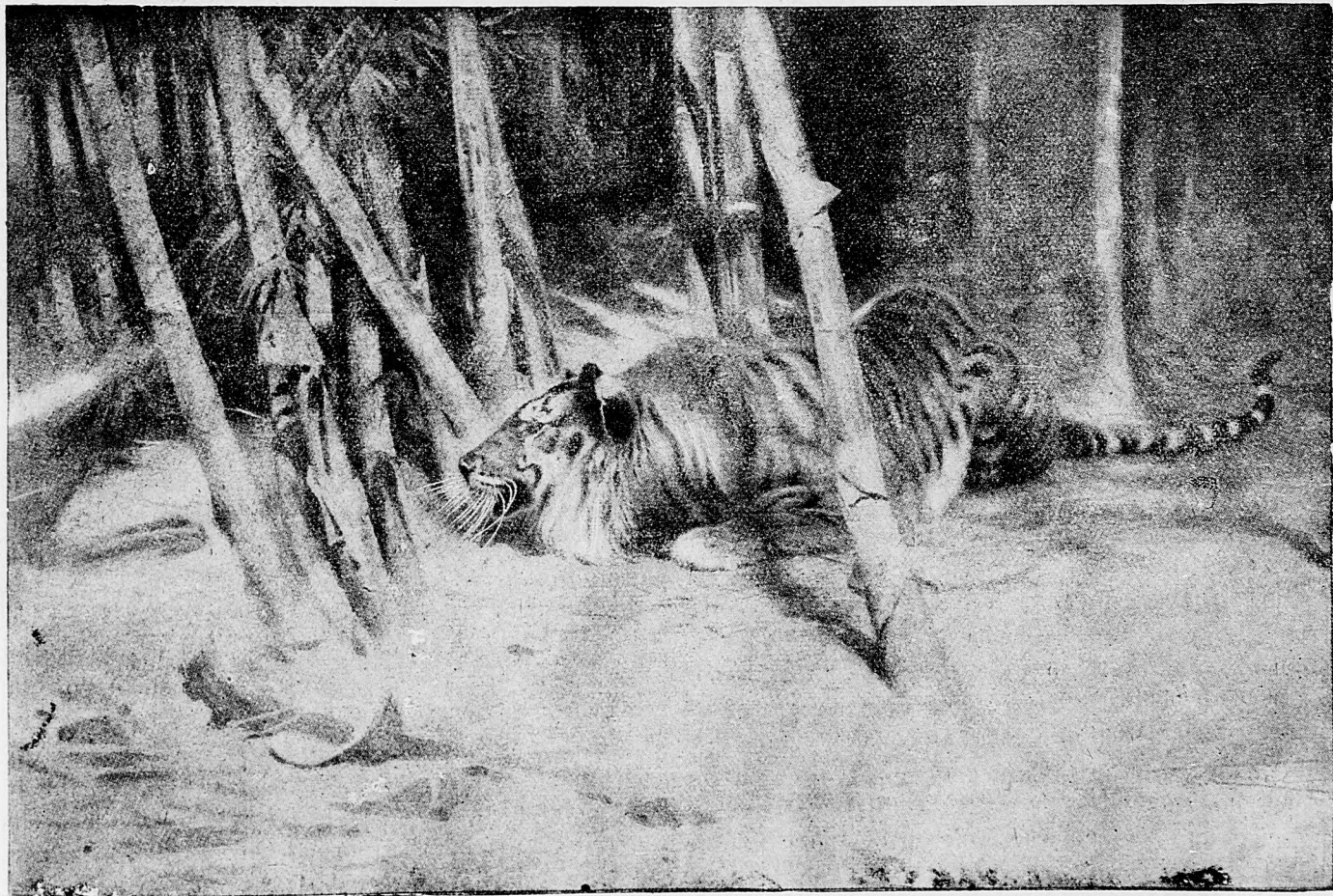
Ulovenie obrovského dravca tigra.

Tri nepriateľské lietacie stroje, medzi nimi jedon francúzsky veľký válečný lietací stroj včera v boji svedenom od Yperna severovýchodne, od Lille na juhozápad a v Champagne, dva ďalšie nepriateľské lietacie stroje však následkom palby nášho delostrelectva a