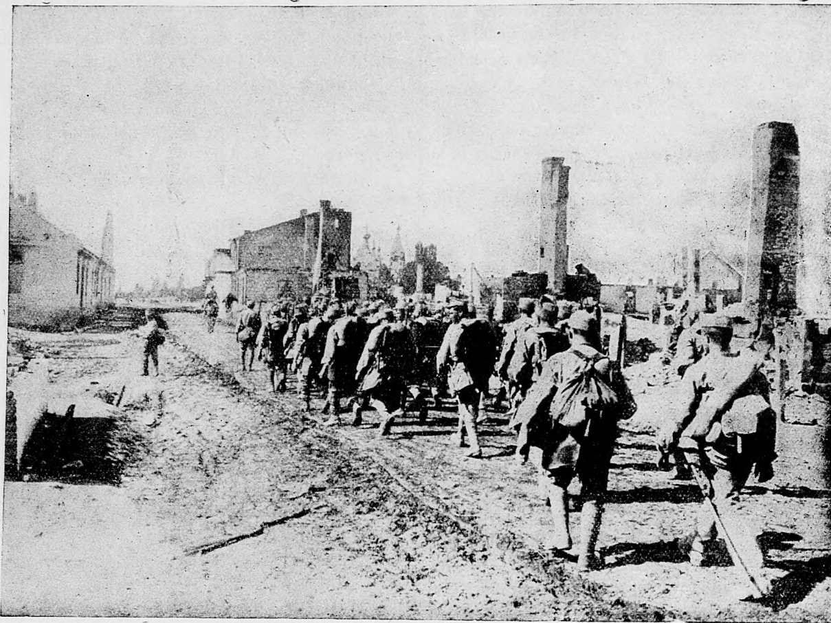
Napredovanie cez mesto Pinsk.