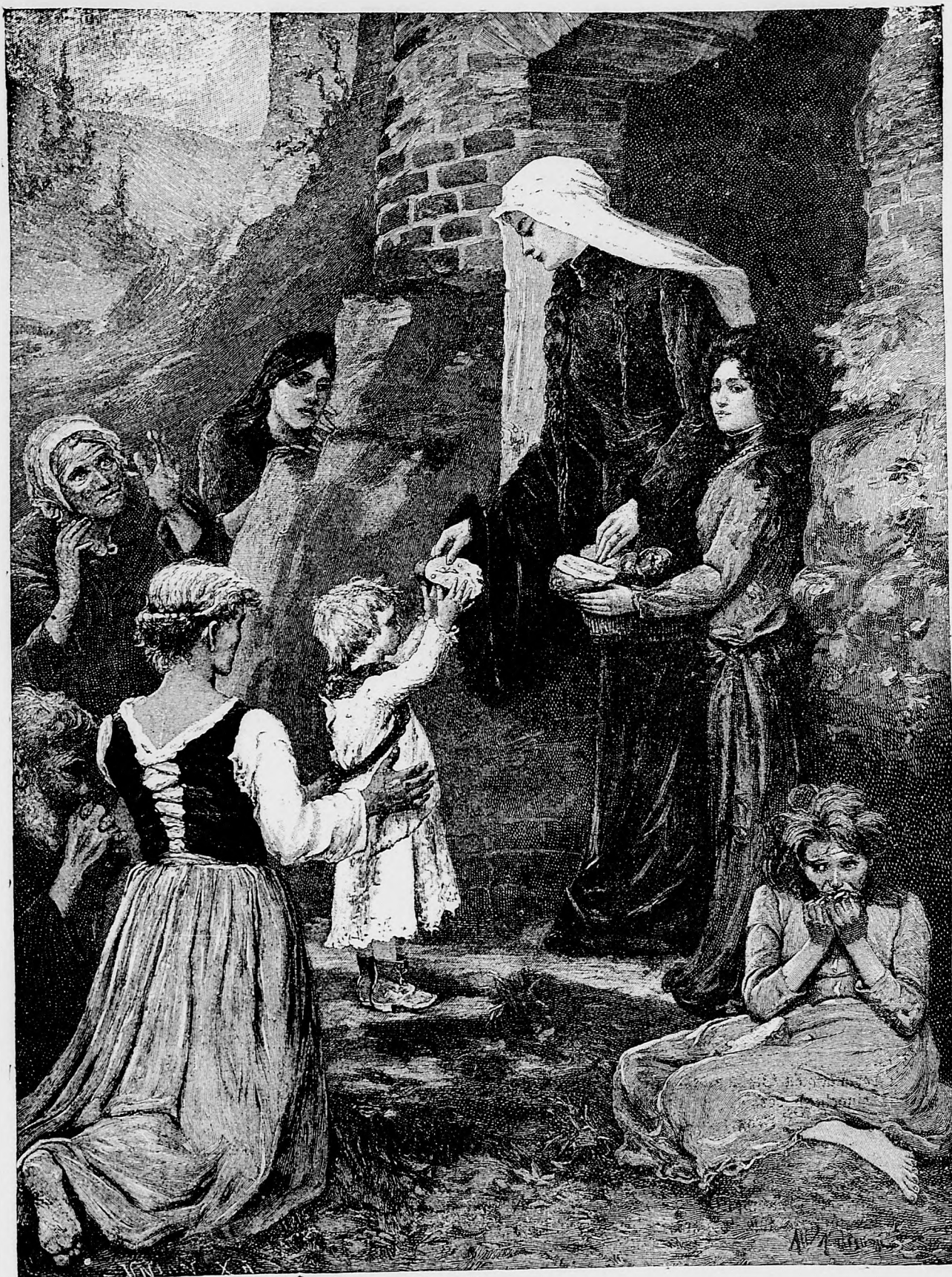
Svätá Alžbeta, uhorská kráľovská dcéra, medzi chudobnými.