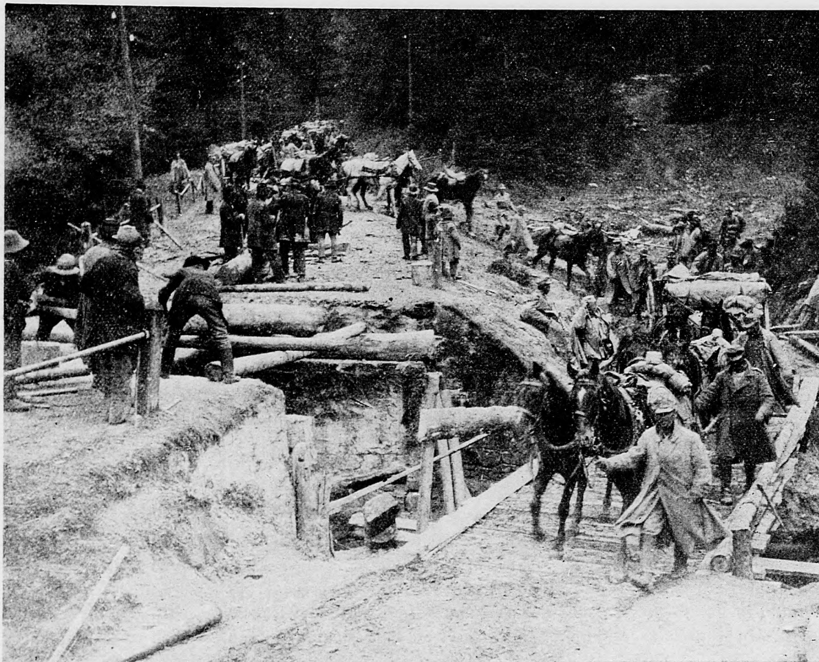
Trén na vrchovej ceste.

8. októbra : V Champagne francúzska ofenzíva trvala ďalej. Po kanónovej pomaly na najväčšiu prud-