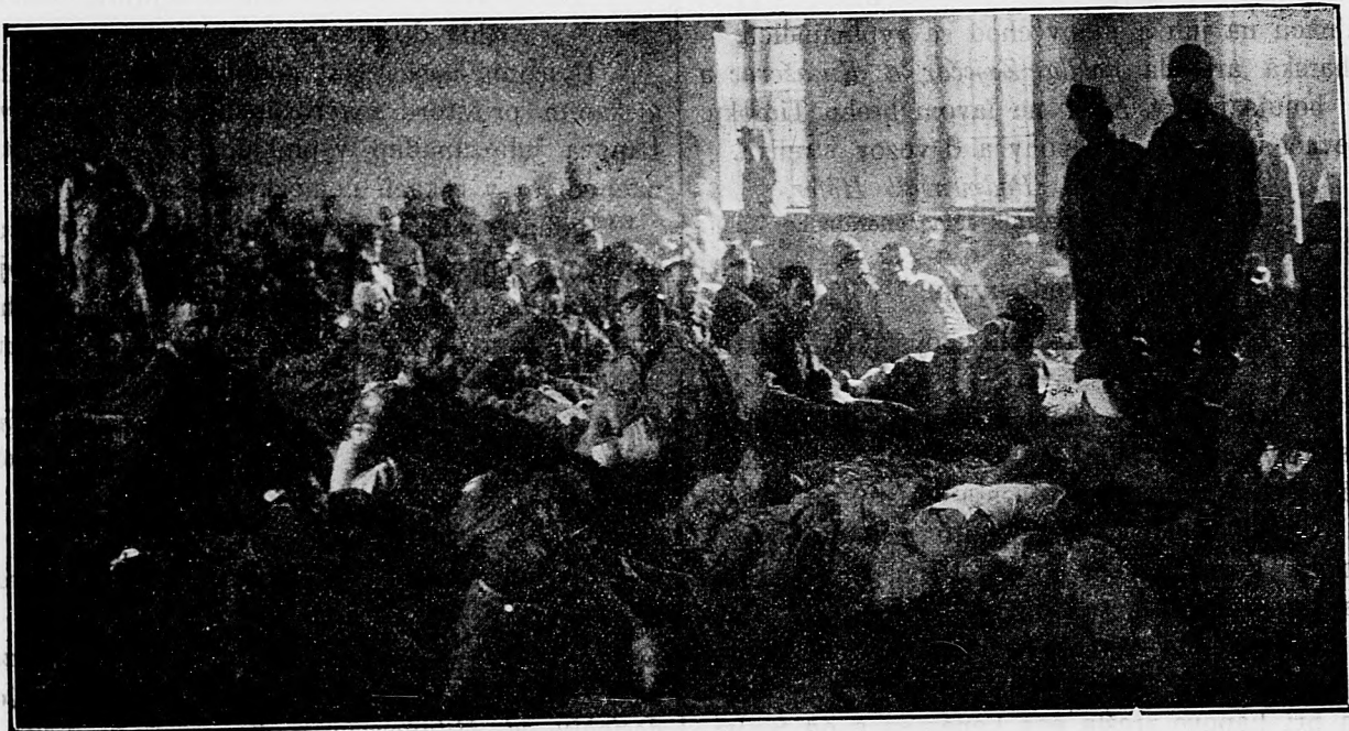
Pred odvezením ranených.

Ostatne niet nič zvláštneho ku sdeleniu.