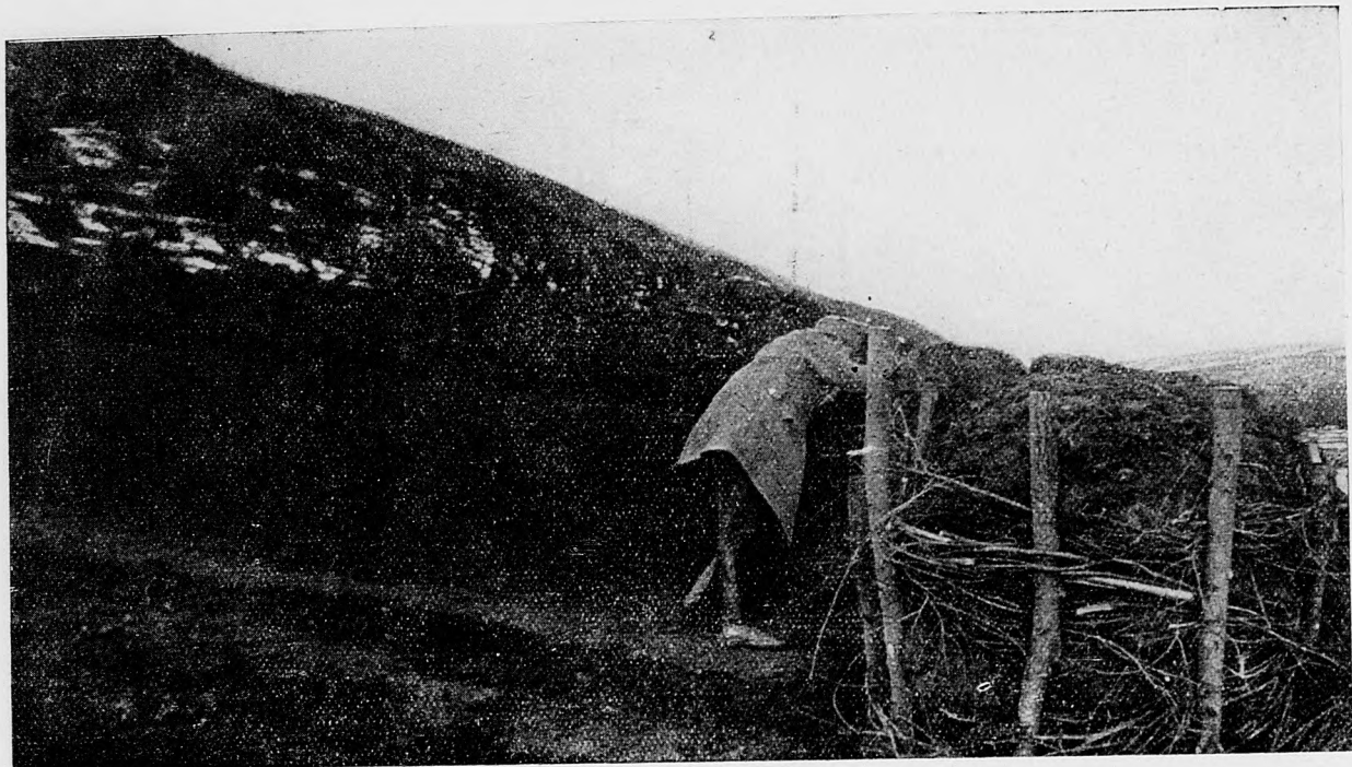
Uhorská stráž na rakúsko-talianskej hranici.

Úradná zpráva z talianskeho bojišťa, vydaná 27. novembra.