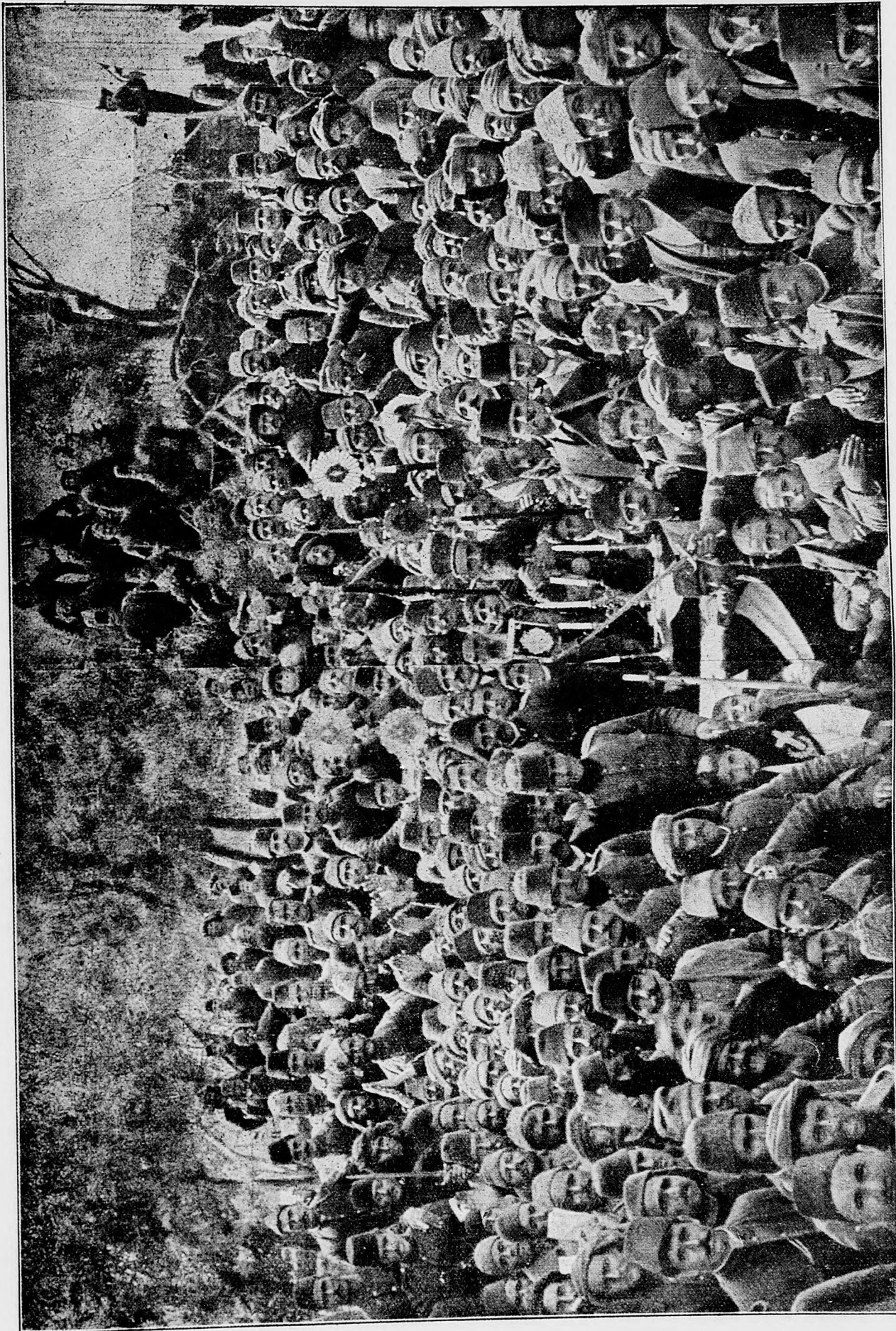
Demonštrácia v Sofii za uhorsko-nemecké priateľstvo.