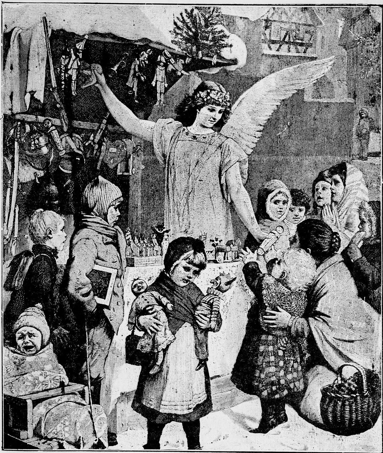
Vianočná radosť maľučkých.

že máme mnoho úradníkov. Lepšie by bolo keby ich bolo menej a viacej by pracovali, potom by zaslúžili aj väčšie platy. V Uhorsku mnokrát preto sriaďujú nové úrady, aby do nich posadili synov takých rodín, čo na vnivoč vyšly. Úrady neslobodno zatvárat pred synami ľudu.