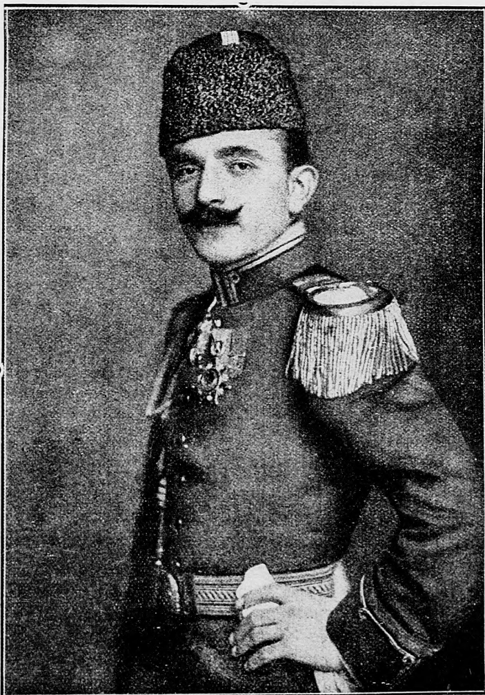
Enver-paša, víťazný turecký vojenský minister

15. januára. V noci na 10. januára nepriateľ zpočiatku so slabšími silami napadol naše posície na ľavej