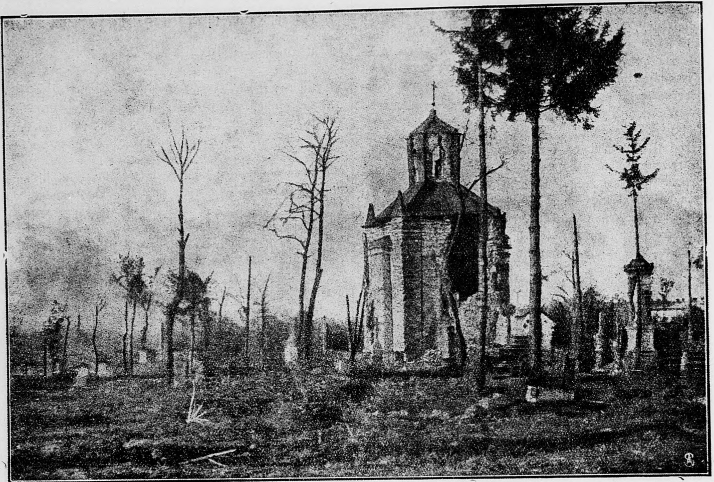
Gorlická kaplna, kde započalo sa zpätzaujatie Haliče.

mesu (Flandria) na západ. Keďže na jednom mieste priechodne podarilo sa im vniknúť do našich posícií, všade sme ich odrazili.