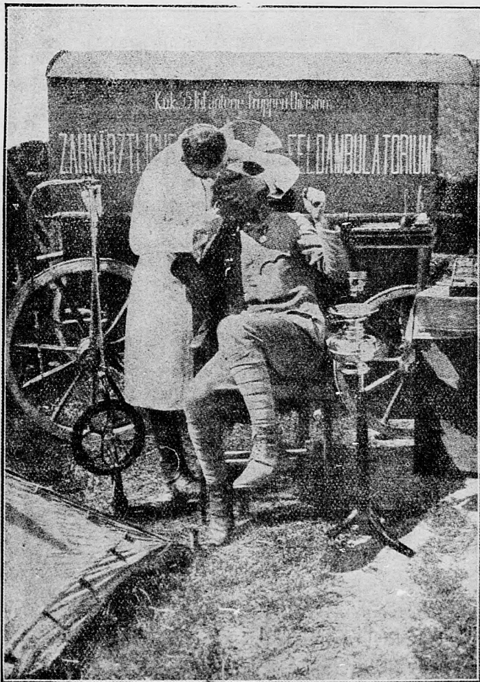
Zubný lekár na bojišti.

1. februára. V noci na 31. januára malé anglické oddelenia pokúsily sa napadnúť naše posície od Messi-