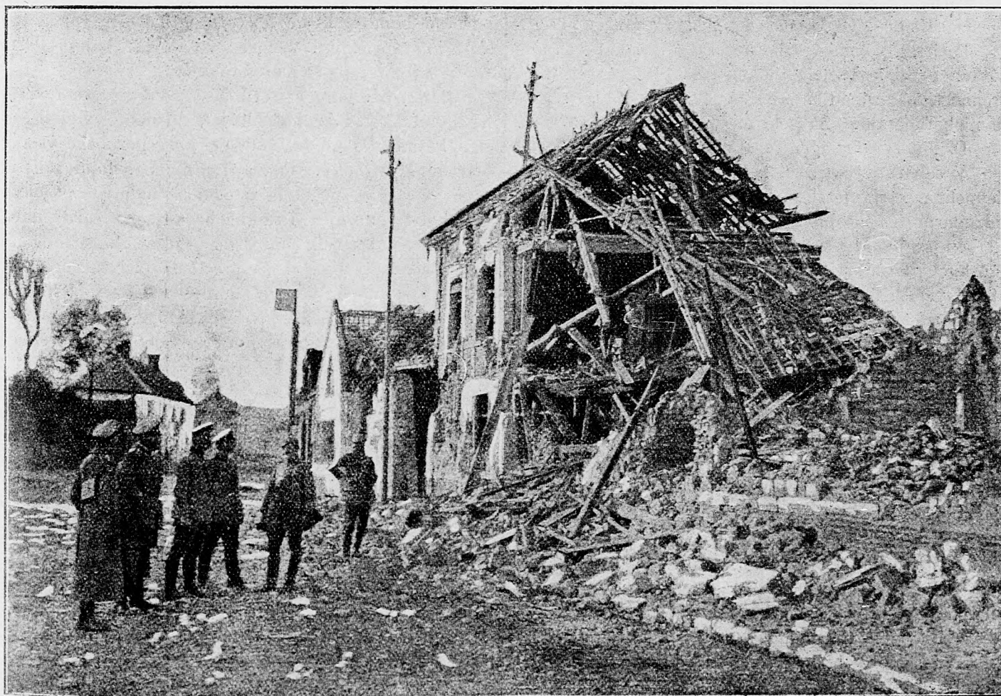
Nemeckými granátmi spustošený dom vo francúzskom meste Arras.

New-York, 1. februára. Reuterova kancelária oznamuje, že pri Kanárskych ostrovoch na Atlantickom oceáne jedna nemecká válečná loď zajala anglický