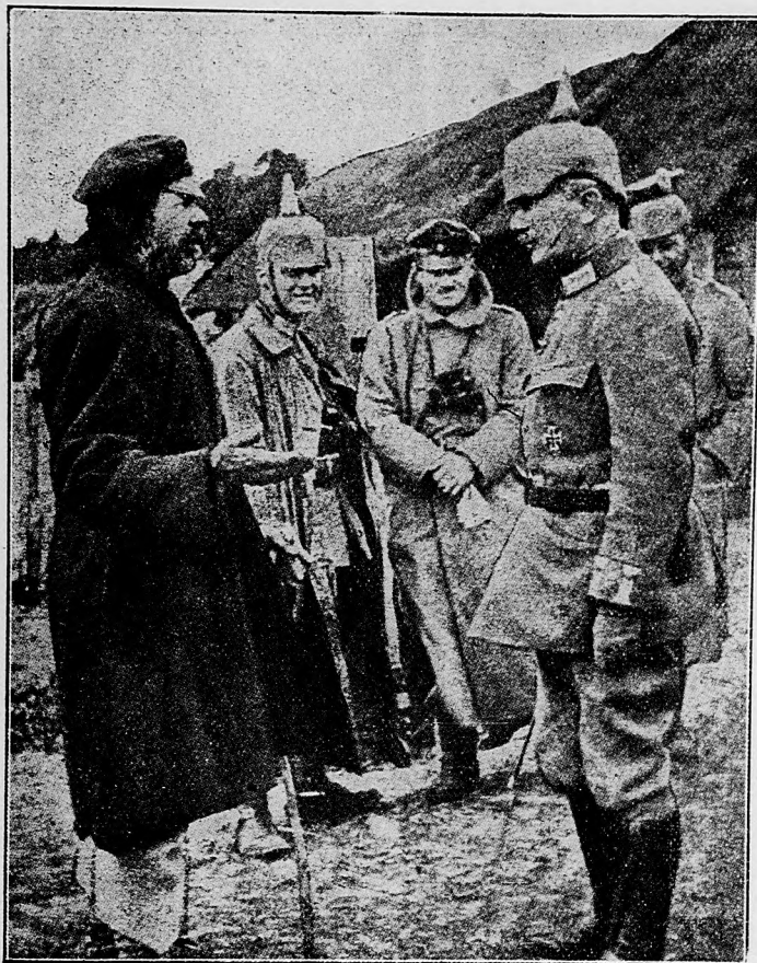
Nemeckí dôstojníci vyslúchajú ruského špehúna.

V čas pokoja jestli rodičia po dedinách dietky do školy poriadne neposielajú, jestli na príklad v čas súrnych poľných prác, snád zcela odôvodnene, doma ich držia, pokutujú ich s najväčšou prísnosťou zákona, čo z ohľadu výučby je snád aj v poriadku. Za každú zanedbanú hodinu na patričných vyrubia aj 1, 2, 4, ba aj 8 korún pokuty. Včul ale hľa, samá vláda už druhý rok nestará sa o to, aby deti riadne chodily do školy.