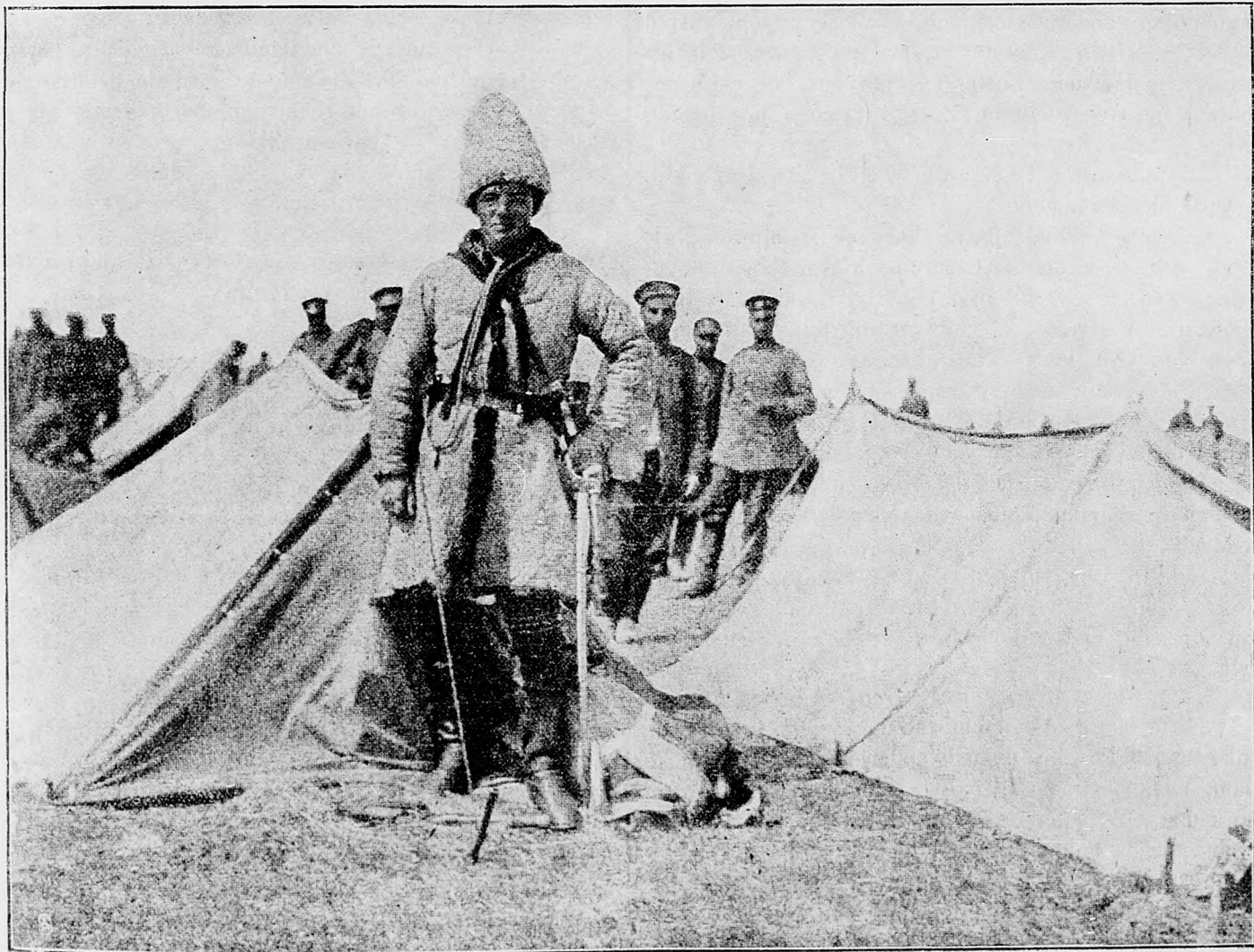
Ruský dôstojník v tábore.

Od Metza na juh jednu napred potisknutú francúzku stráž sme prekvapili a všetkých jej mužov, počtom vyše päťdesiat, sme zajali.