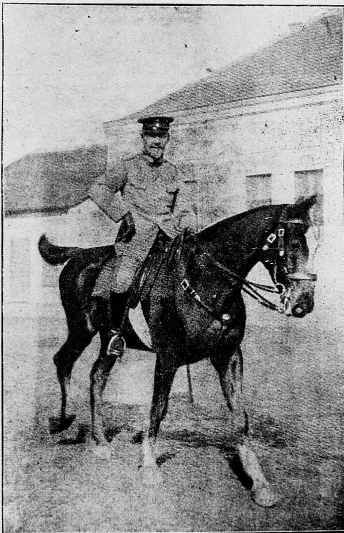
Galwitz, nemecký generál, vodca nemeckých čiat v Sidsku.

Predpoludním naše bataillony — medzi čím menšie oddelenia prešli cez dolný tok rieky Arzen — dostaly do svojej moci posledne napred potisknuté posície nepriateľove od Bazar-Šjaku na východ. Na poludnie taliansku brigádu Savona aj z jej hlavnej, silne vybudovanej posície, ležiacej od prv spomenutej obce na východ. Súčasne druhý stĺp útokom dobil od Durazza asi na 10 kilometrov ležiace šiance pri Sasso-Bianco. Nepriateľ svoje zákopy zčiasťky útekem o zlom-krk zanechal a utiahol sa za vnútorný ochranný pás.