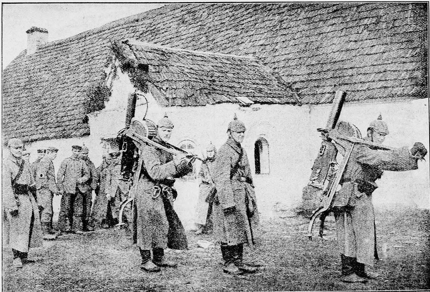
Nemeckí vojaci strojové pušky na pleciach nesú do strelných zákop.

Londýn, 4. marca. Agen. Lloyds oznamuje z Bor-