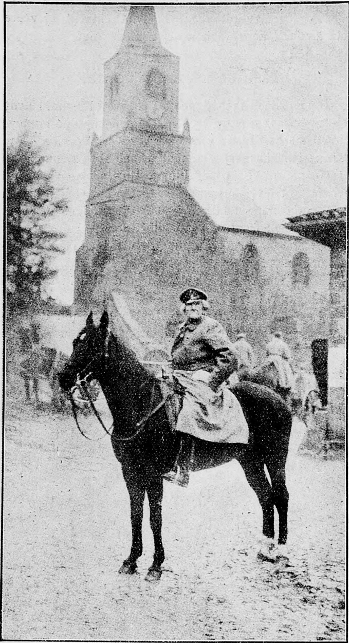
Gróf Haeseler, nemecký veliteľ armády, tieto dni slávil 80-ročné narodeniny.