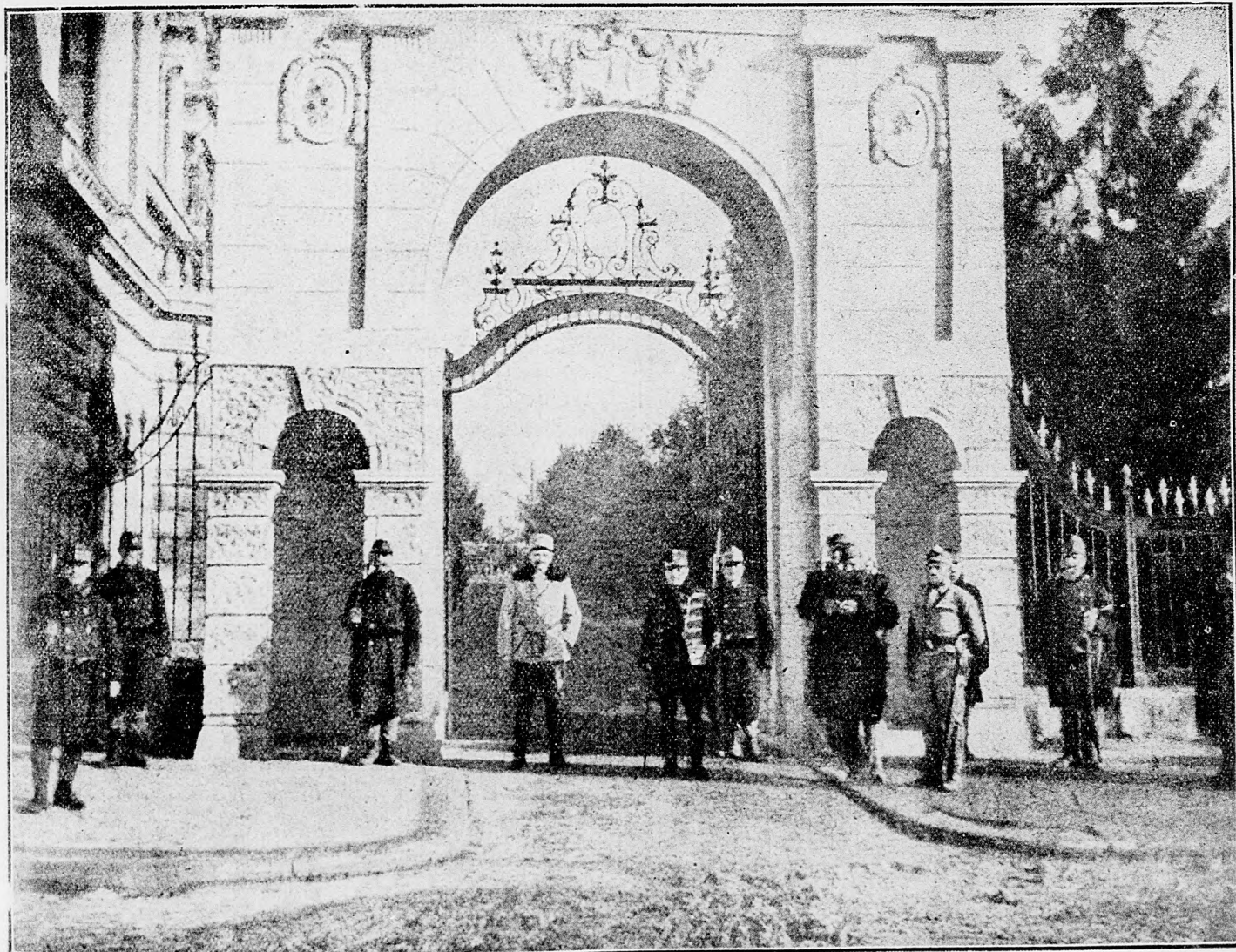
Uhorski bakančoši na stráži pred belehradským palácom bývalého srbského kráľa Petra.

Železničnú čiaru medzi Ljabovičiami (od Baranovičov na juhovýchod) a Luminecom, na ktorej sme spozorovali silnejšiu premávku, naši letúni s dobrým výsledkom napadli.