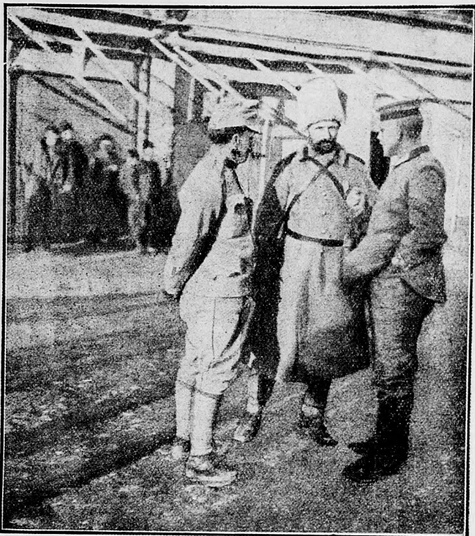
Uhorskí, nemeckí a bulharskí vojaci v Srbsku.

predbežne nastala tichosť. Posícia, ktorú sme už aj pred 14. februárom držali, je pevne v našej moci; posícia Bastion ostala v rukách nepriateľa. V Champagni živšie delostrelecké boje trvaly aj včera. V Argonnách jeden slabší nepriateľský útok sa zmaril.