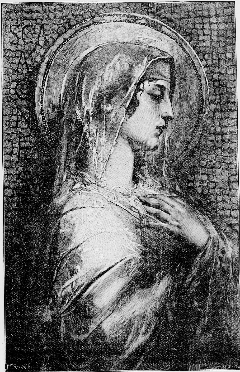
Preblahoslavená Panna Maria, oroduj za nás!

Pariž, 17. marca. (Havasova kancelária.) Finančný minister Ribot dnes popoludní oboznamoval finančné