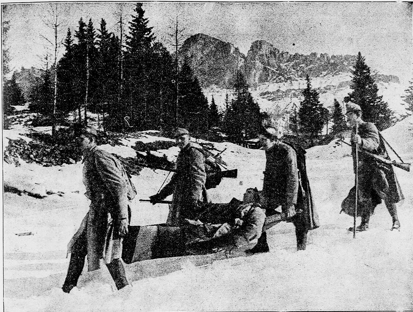
Z talianskeho bojišťa: Naši vojaci na bezpečné miesto nesú raneného ich súdruha.