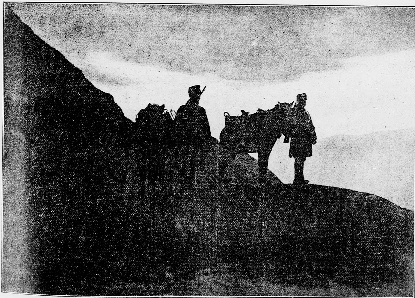
Východ sinka v tyrolských vrchoch.

19. marca. Od Vermellesu na severovýchod (od kanála La Bassée na juh) po účinlivej delostreleckej