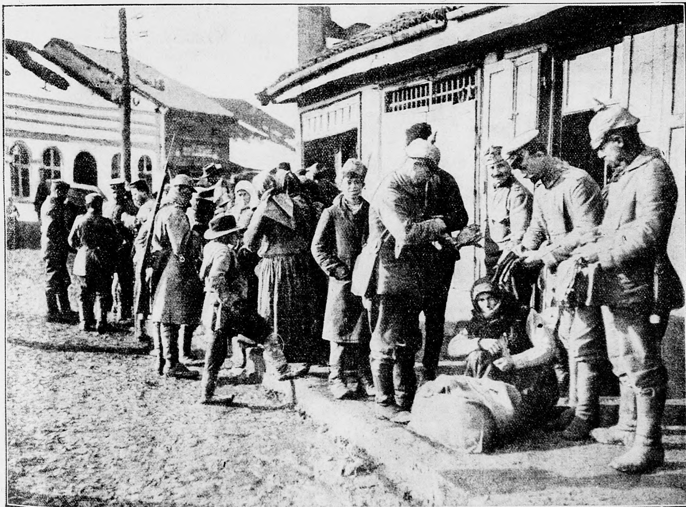
Nemeckí vojaci dohán kupujú od srbských kupcov.

Balkánske bojište : Významnej udalosti nebolo.