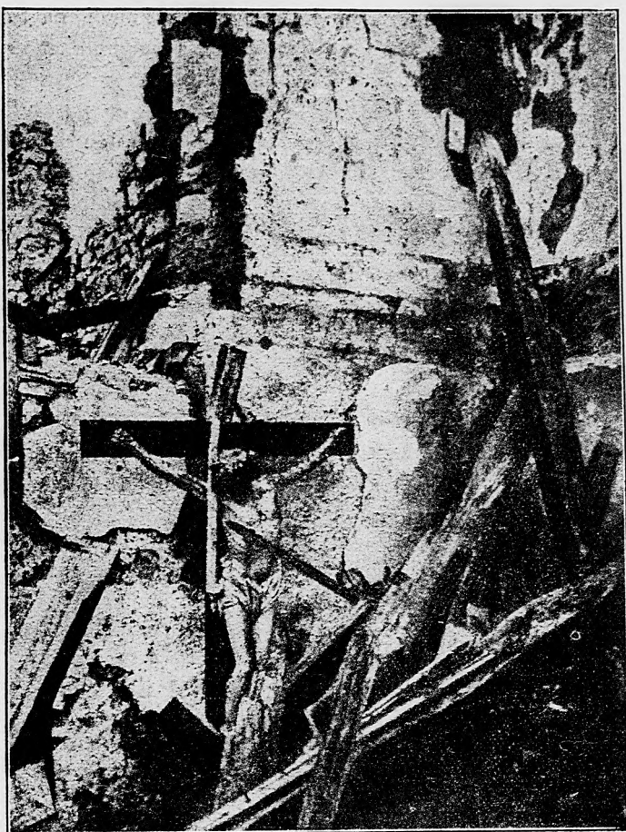
Taliani bombami spustošili kostol «Monte Sant» pri Gorici.

Rotterdam, 10. apríla. Včera v Häge na jednom shromaždení odzneli prudké hlasy proti držaniu sa vlády v terajšom kritickom položení. Viac rečníkov žiadalo, aby vláda oboznámila pomer Hollandska ku cudzím štátom. Všetci rečníci vyzvali robotníkov, aby