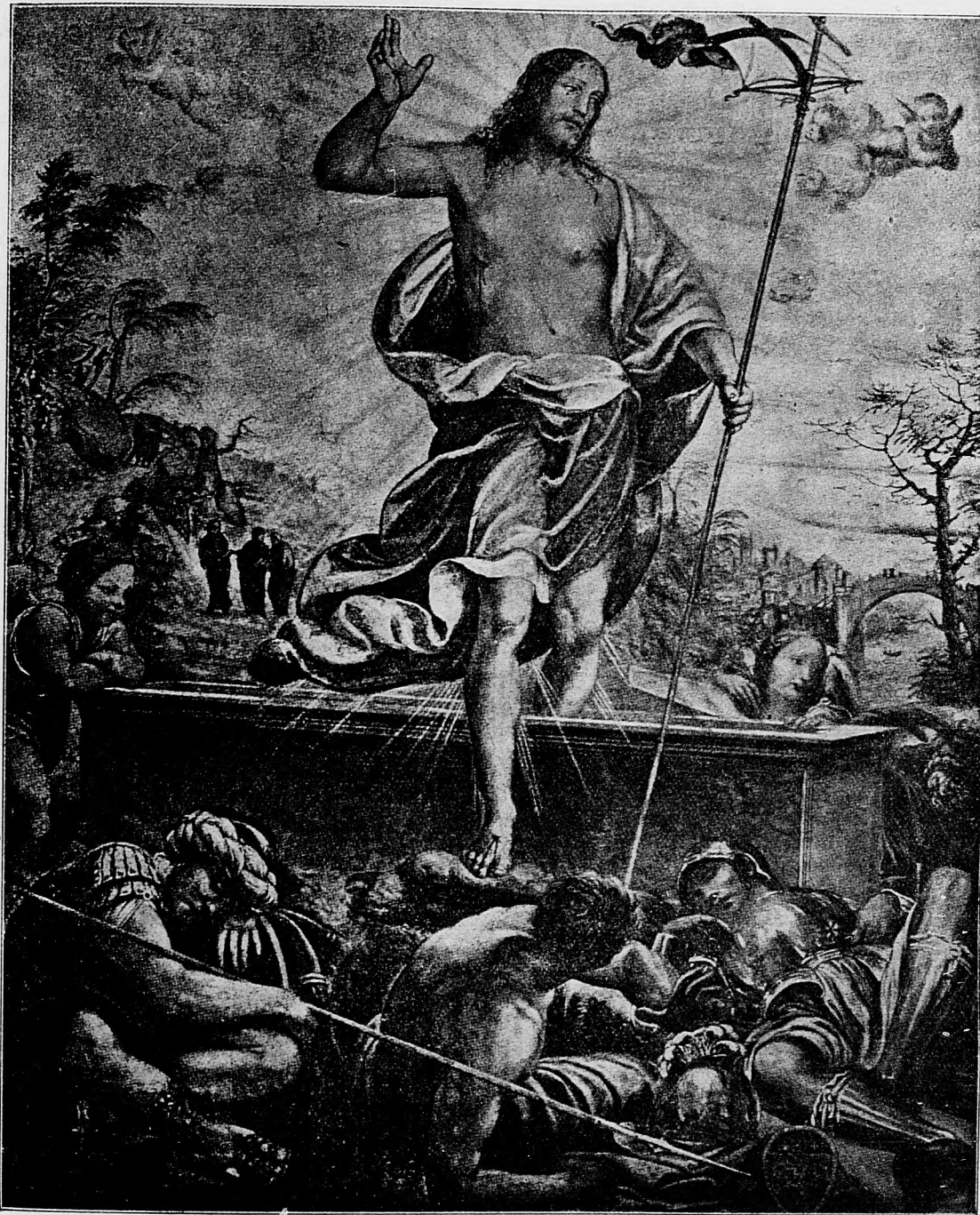
Pán Ježiš vstal z mŕtvych. — Alleluja!

válečné operácie. Bulhari si ale pomohli organizovaním bánd, ku ktorým prideliť regulárnych dôstojníkov. V Mirditii je asi 1500 hláv počítajúca albánska čata, ktorá pracuje všetkými modernými prostriedkami vál-