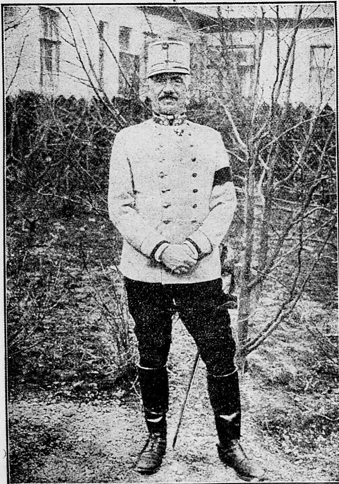
Pflanzler-Baltin, veliteľ bukovinskej armády.

Kaukazský front : V centre prevrapujúci nočný