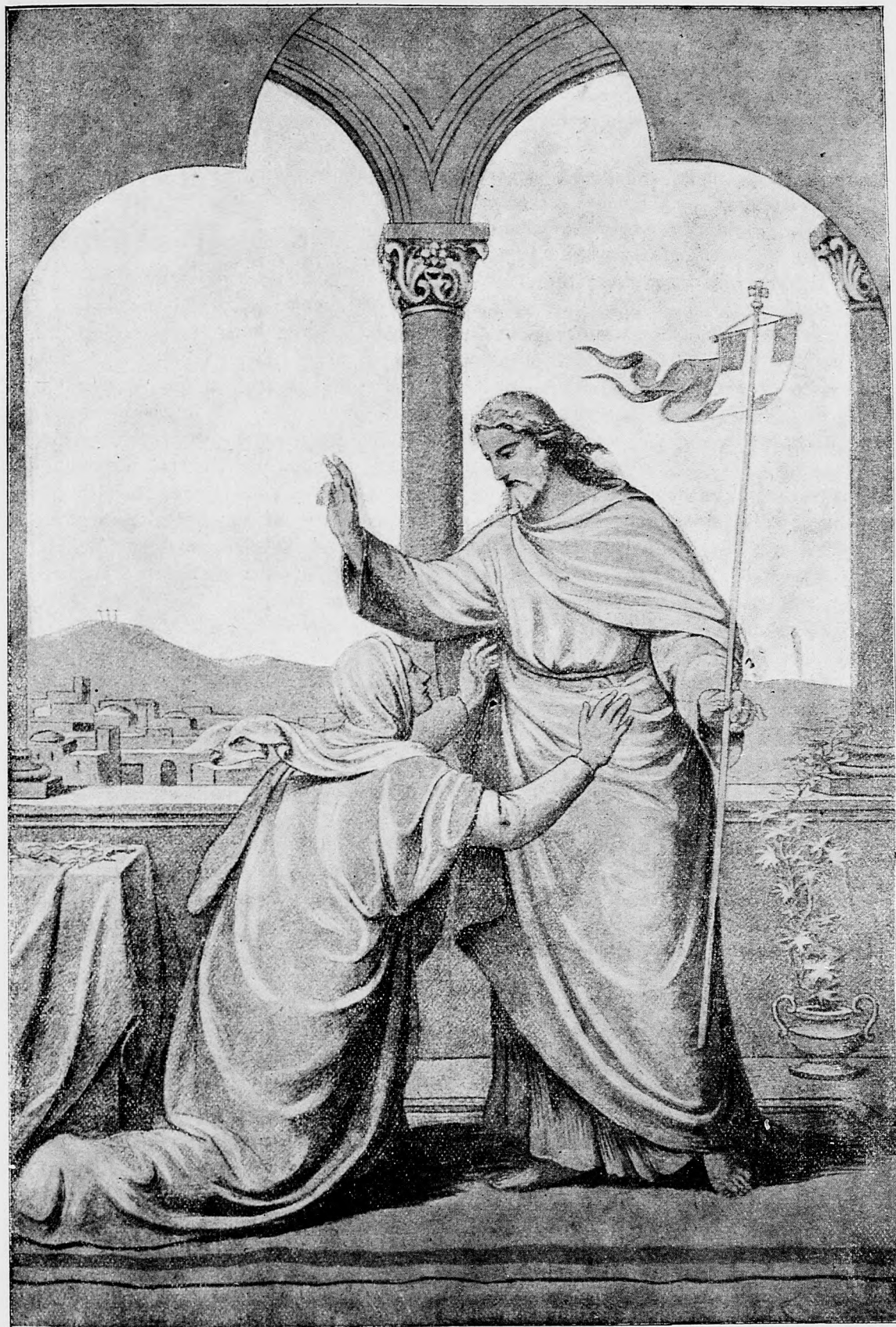
Pán Ježiš po slávnom zmŕtvýchvstani zjavil sa Marii Magdalene.

a aby posúdila, či vláda zaslúži dôveru komory. Potom obšírnejšie hovoril, že čo vykonala talianska vláda na ochranu neodvislosti Srbska, jako zachránila talianska flotta z krajiny utekajúcich Srbov a Černohorcov a bráni sa proti obviňovaniu, že Taliansko neposlalo