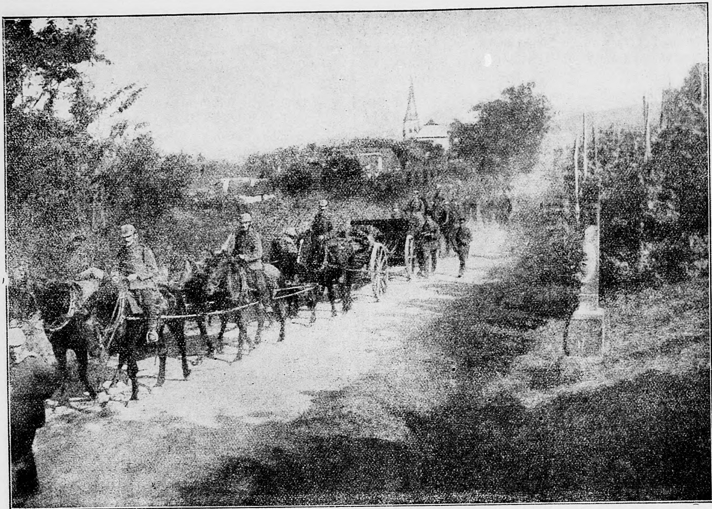
Nemecké delostrelectvo vo Vogézoch pri napredovaní.

tadlá, ktoré aj na nepriateľsku loď hodily bomby, palbou strojových pušiek odohnaly. Dňa 18. t. m. jeden nepriateľský monitor bezúčinku vystrelil niekoľko ráz na predhorie Karatas na ostrove Küsten.