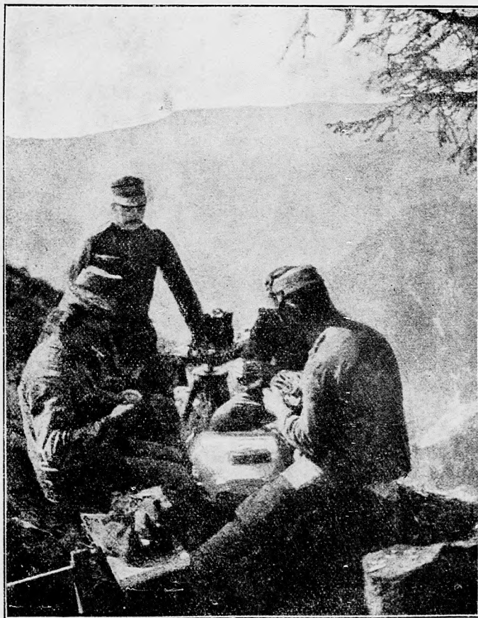
Na talianskom fronte odpočívajúci vojaci.

Sýrske pobrežie : Jedon hydroplan, ktorý bol vyletel z jednej lode, stojacej na výške Gazzu, dve naše lie-