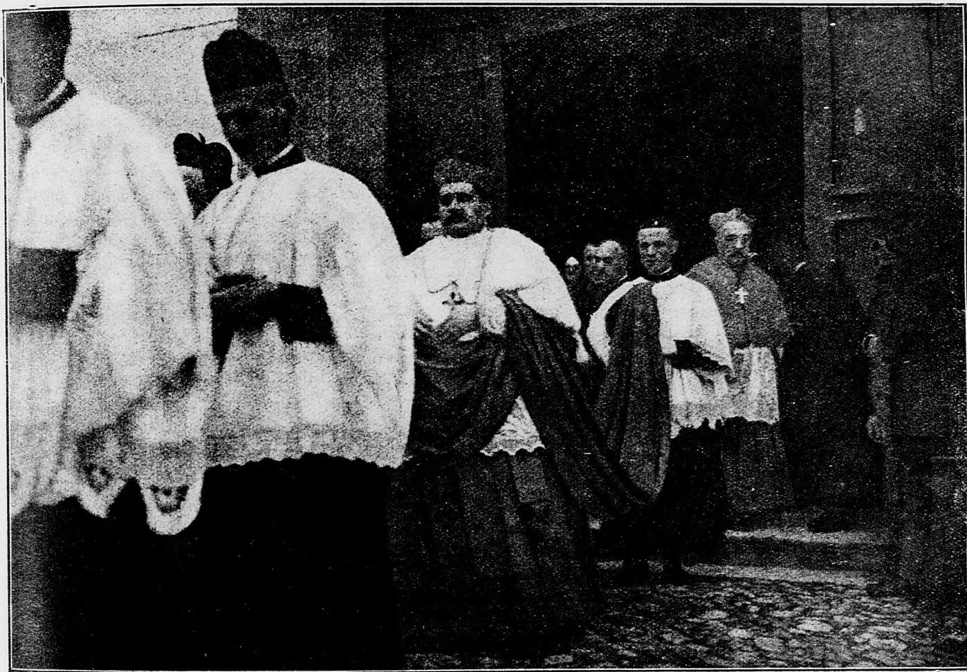
Prvé cirkerké vďakovvzdávanie po zaujatí Skadry (Skutari).

Kaukazský front: Na pravom krídle žiadnej zmeny. Na odseku Čuruku proti našemu pravému krídlu urobený nepriateľský útok sme pristavili, jedného dôstojníka a 60 vojakov sme zajali.