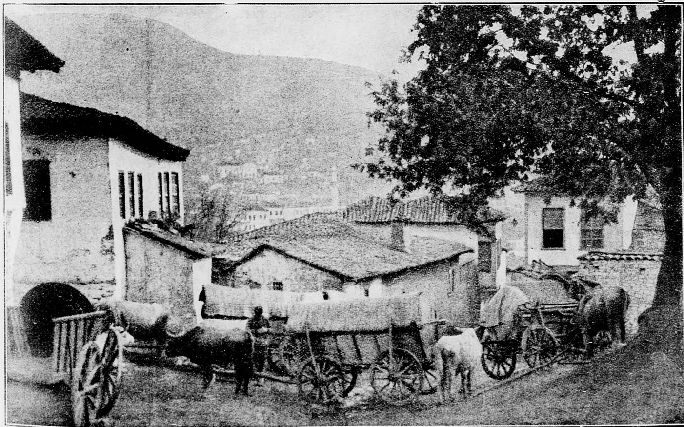
Mesto Vales v doline Vardaru pozdĺž salonickej železničnej čiar.

Ináče krem delostreleckej palby, ktorá miestami bola živá a krem bojov niektorých patrol, zvláštnej udalosti nebolo.