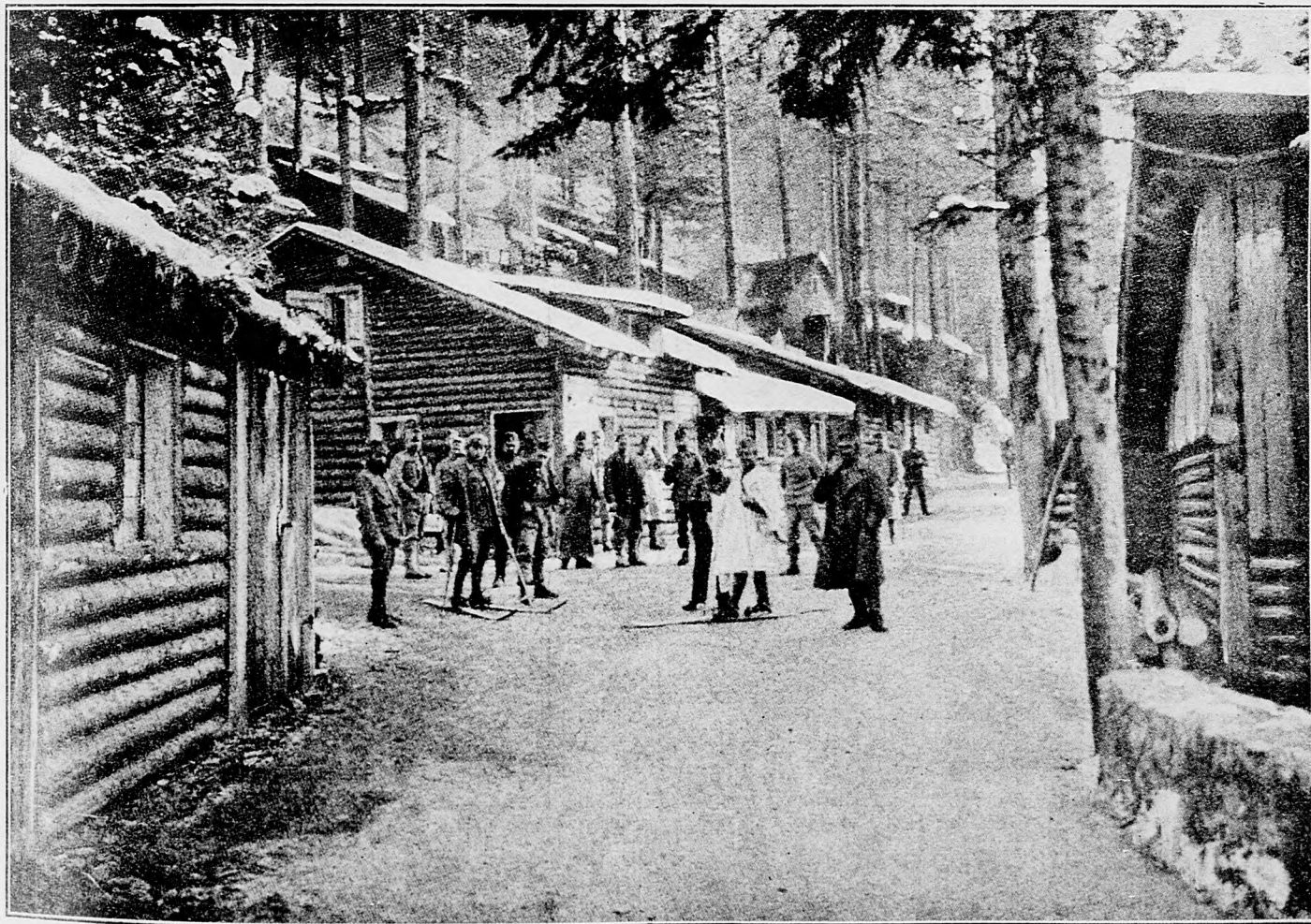
Vojenská dedina na talianskom bojišti.

Na primorí, na fronte Isonza Taliani tiež prestali útočiť na naše posície. Na juhozápadnom kraji Doberdovskej planiny, o ktorý sa na sviatky viedly živé boje, ktoré sa skončily s odrazením nepriateľa, prudkosť talianskych útokov klesla, kdežto naše čaty vydobily na tomto území pekný zdar. Od San Martina na severozápad postúpily až po nepriateľské čiary a keď