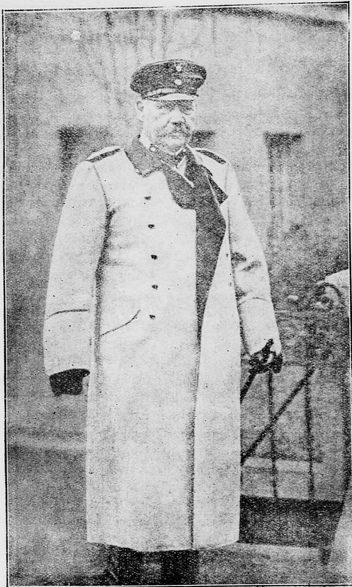
Hindenburg, nedávno slávil 50-ročné jubiläum vojenskej služby.

Od začiatku útoku spočítali sme 23.883 válečných zajatcov, medzi nimi 472 dôstojníkov. Naša korisť zvýšila sa na 172 kanónov.