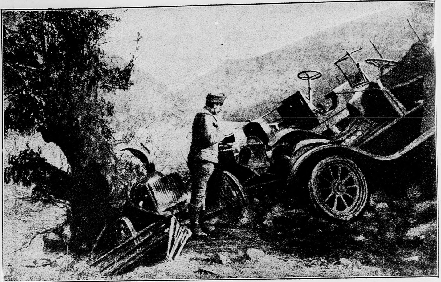
Spustošený automobil pri Kulaljovne.

stranách hradskej Haucourt—Esnés opätovne urobene útoky nepriateľa zase ľahkým spôsobom sme odrazili.