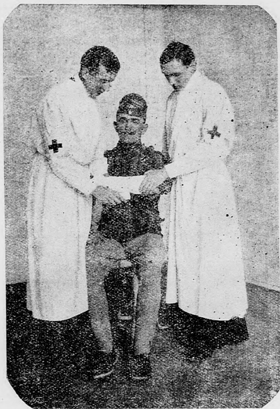
Klerici obväzujú raneného vojaka.

20. mája. V Argonnách nemecké patroly po vlastných výbuchoch do druhej nepriateľskej čiary postúpily