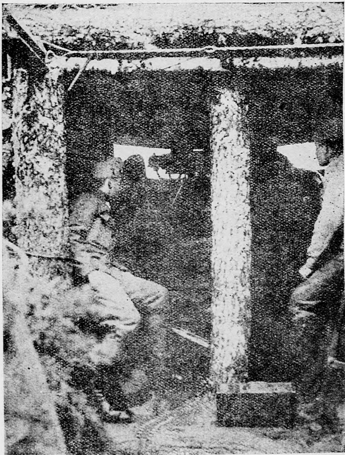
Oddelenie strojových pušiek v istom úkryte pred granátmi.

Proti našim minule zaujatým posiciam na oboch