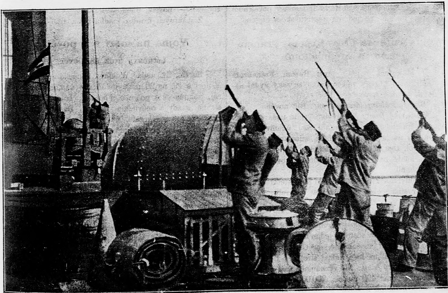
S válečnej lode strieľajú na lietací stroj.

24. mája. Juhozápadne od Givenchy značné anglické sily viac ráz napadly naše nové posície. Do našich zákop vnikli len po jednom a všetci padli v boji z blízka. Ostatne všetky útoky Angličanov odrazili sme s veľkými ich ztratami, podobne zahnali sme menšie oddelenia aj pri Hulluchu a Blairville.