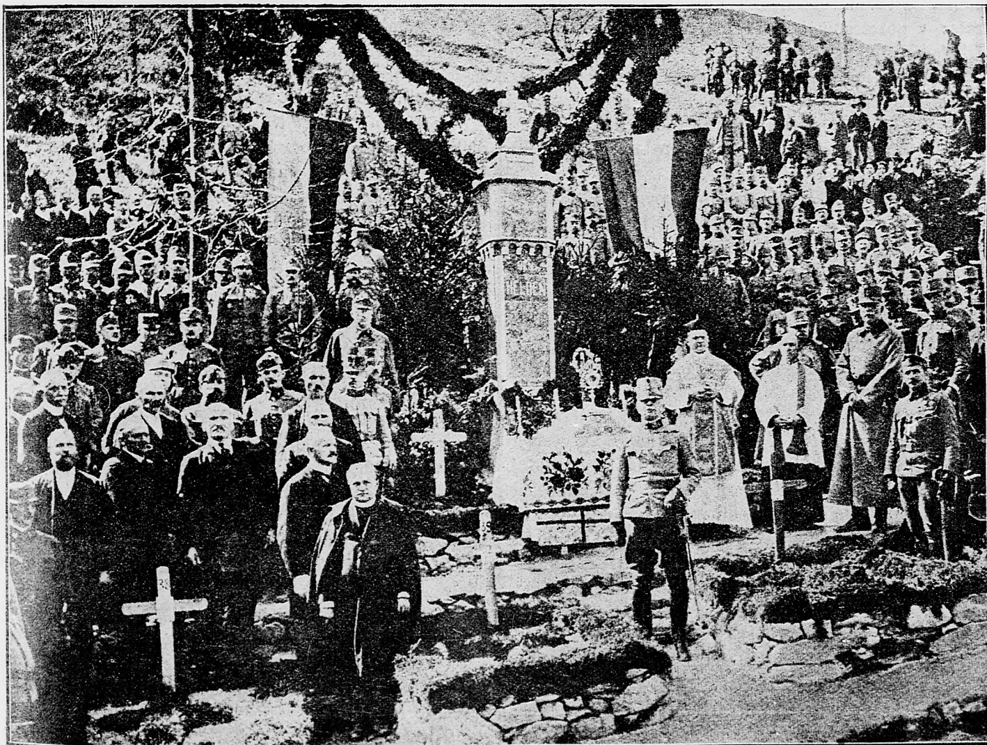
Slávnostné odhalenie pomníka pri Isonze padlých uhorských a rakúskych hrdinov.

Na západnom brehu Maasu naše delostrelectvo