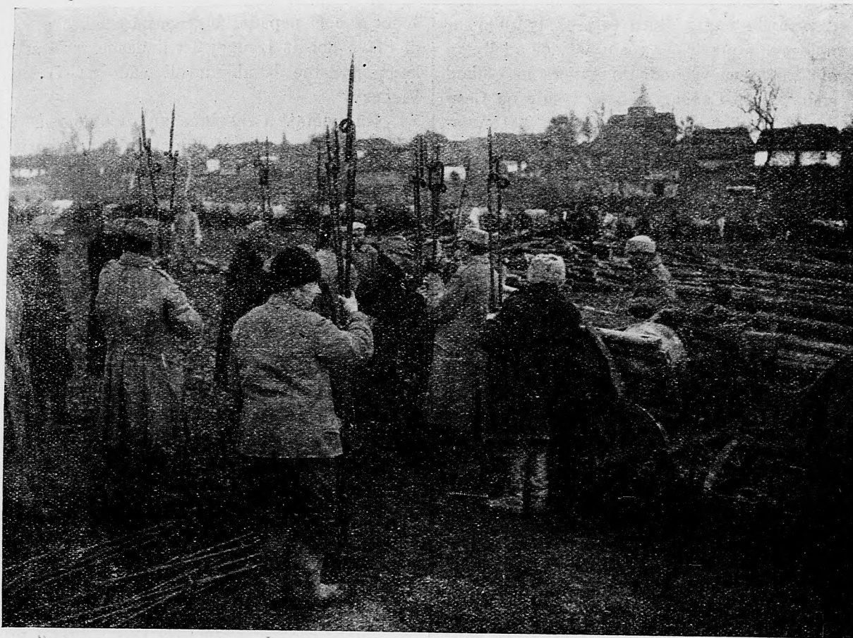
Váleční robotníci v Srbsku.

Medzi Ulynovom pozdĺž Ikvy a územím od Olyky