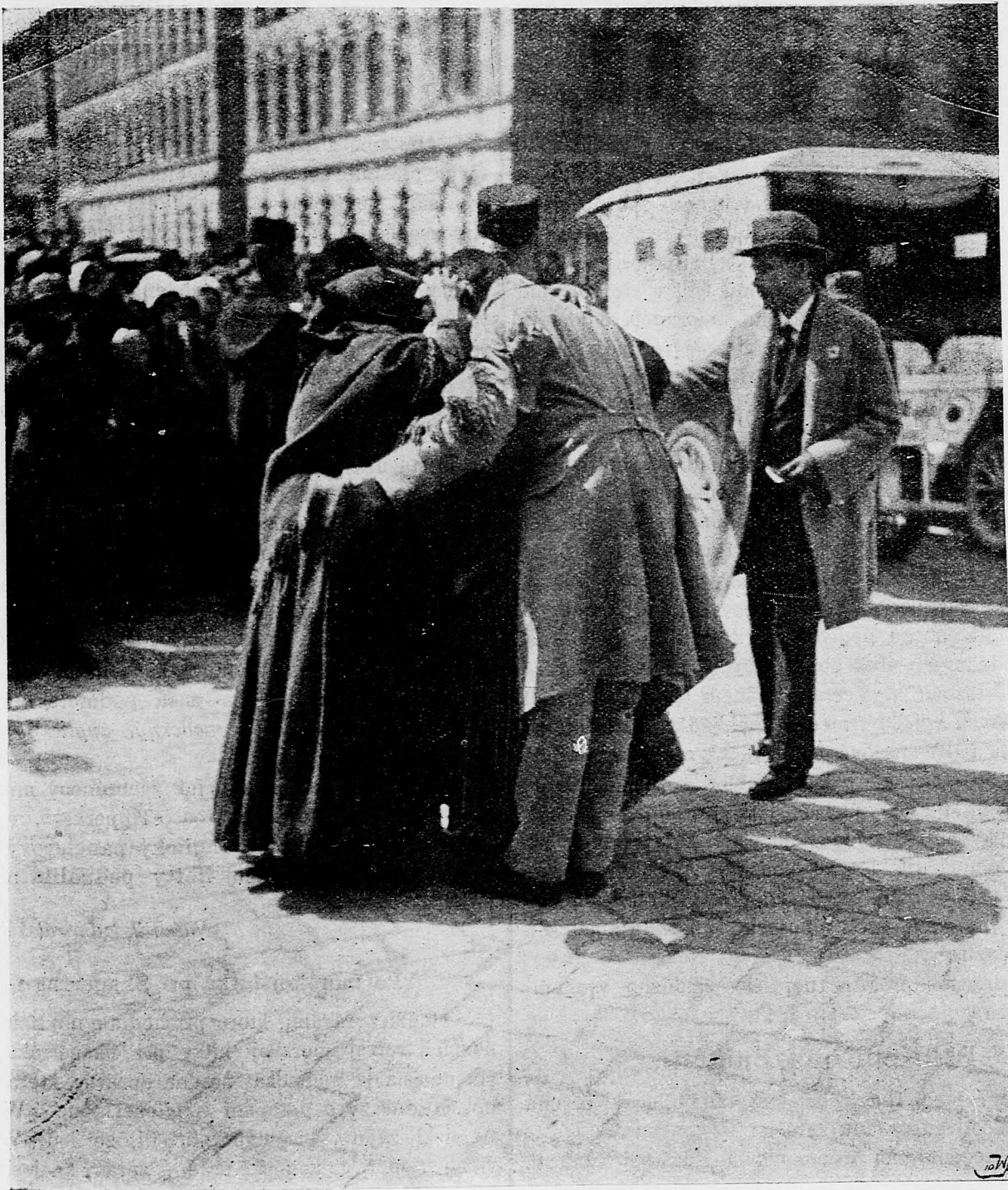
Z ruského zajatia vráťivší sa invalid na budapeštianskom nádraží spatrí svoju matku.

na sever a na východ sa vypínajúce (na 50 kilometrov juhovýchodne od Mahamatuna) a výšinu 2650 v pohorí Majramskom (na 16 kilometrov severovýchodne od Mahamatuna). Na ľavom krídle silné nepriateľské výskumné oddelenie našimi oddeleniami boli porazené.