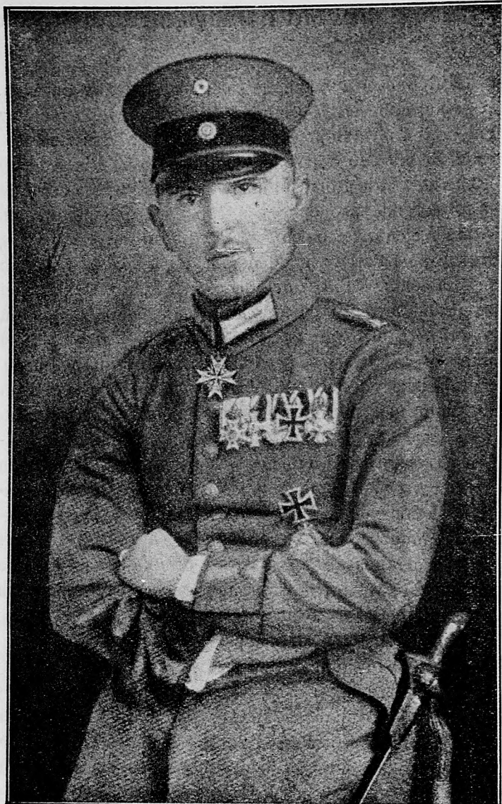
Immelmann, nemecký chýrny letúň, ktorý sostrelil 18 nepriateľských lietadiel, konečne ale nešťastlivo sletel a zomrel hrdinskou smrťou.

skej légie, tento pohyb bolo možno previesť bez pomýlenia zo strany nepriateľa.