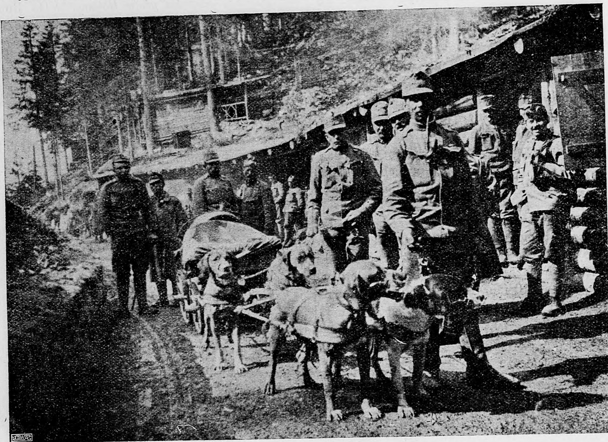
Psi vo válečnej službe.

Od Stochodu na východ naše letúnske roje pokračovali v útočivej činnosti.