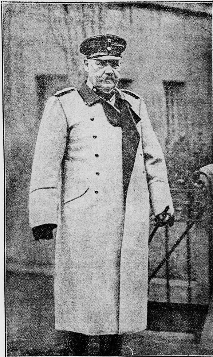
Hindenburg, nový hlavný veliteľ.

Akonáhle sliepky začnú niesť prvé vajcia, od každej sliepky osobite odložíme 8—10 vajec. Tieto vajcia podsypeme pod kvočku, alebo ich vložíme do stroja na liahnutie, na siedmy deň pri lampe sa presvedčíme, že či sa z vajec vyľahnu kurenice. Táto próba nám povie, že z vajec ktorej sliepky vyľahne sa najviac kurenice. Príčina toho, že sa kurenice vo vajciach nezaviažu, môže byť pravda aj v kohútovi. Takéhoto kokúta odstráňme zo dvora a preto je dobre nechať si vždy aj v zásobe kohúta.