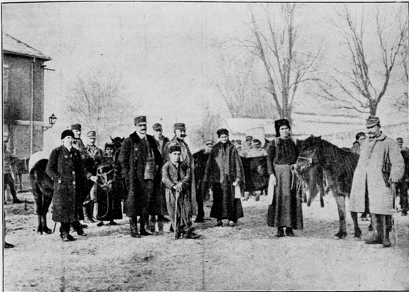
Koňský jarmok na Cetinji (Čierna Hora).

povetrie, požitý nápoj a potrava. A tieto tým viac ochladia vnútornosti, čím studenejšie boly, keď sa dostaly do zvierata, v ktorom sa v istom čase natolko zohrejú, aké teplo nachádza sa vo zvierati. Nápoj a potrava v žalúdku zohreje sa tým teplom, ktoré sa v žalúdku nachodí. Teraz, keď vezmeme do ohľadu, že v lete nepotrebujú zvieratá veľa tepla zvonku, ba usilujú sa ho sprostíť, taktiež to, že v zime ho zase vyhľadávajú a keď ho nemôžu najst, sem a tam sa pohybujú, aby vnútrajšok povzbudily k činnosti, to jest ku