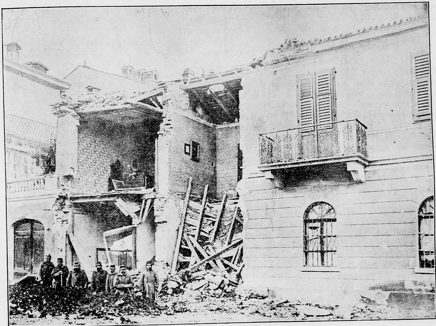
Na polo rozstrieľaný dom.

Keď Rusi v Bukovine a v Lesnatých Karpátoch, kde je už tuhá zima, tak sa zdá, odstúpili od offensívy, teraz od Lucku na západ na dvoch bokoch železničnej čiar Brody—Lemberg pozdĺž Narajovky s celou silou