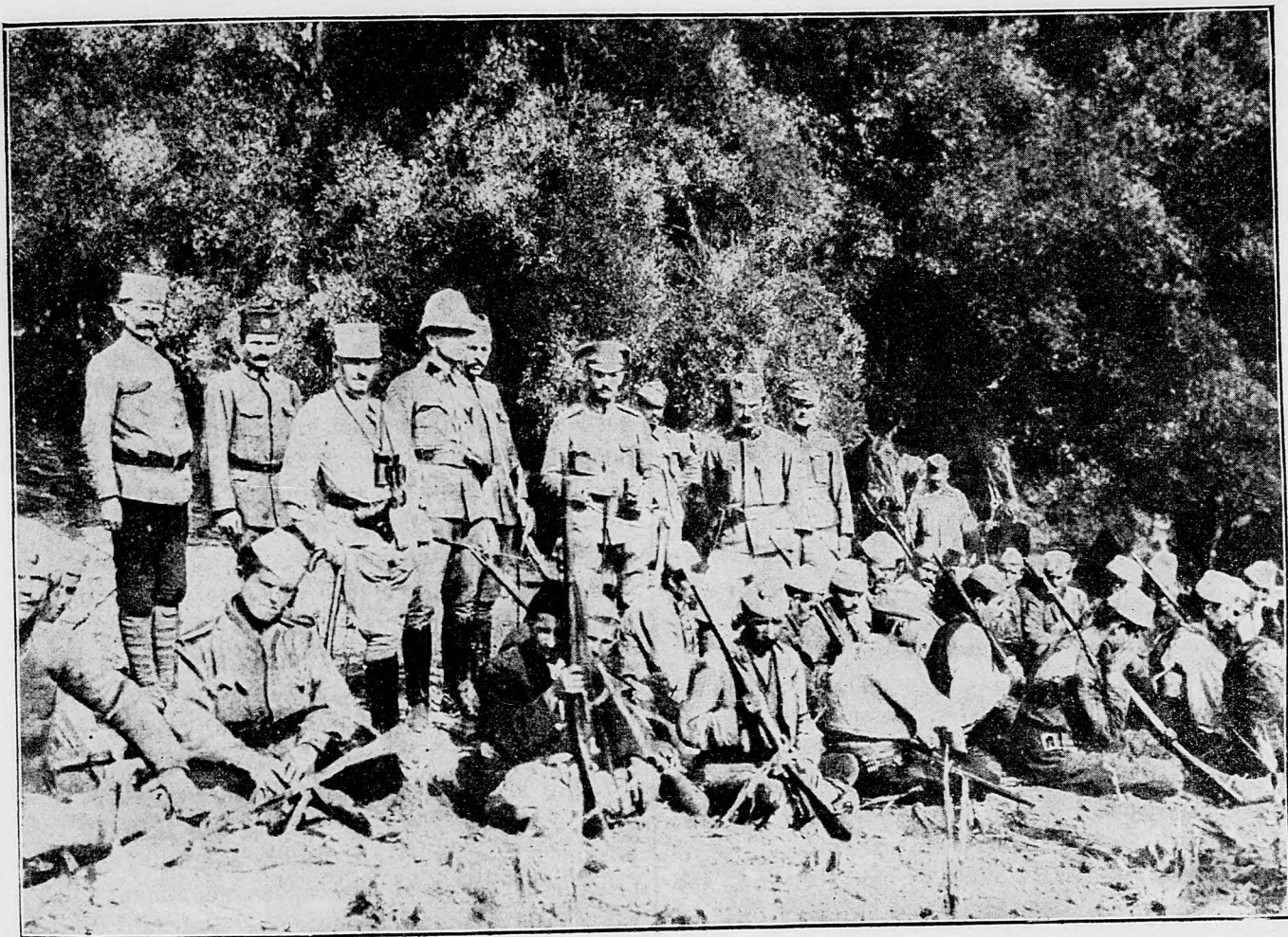
Uhorskí a albánski vojaci s ich dôstojníkmi pri rieke Vojuši v Albánii.