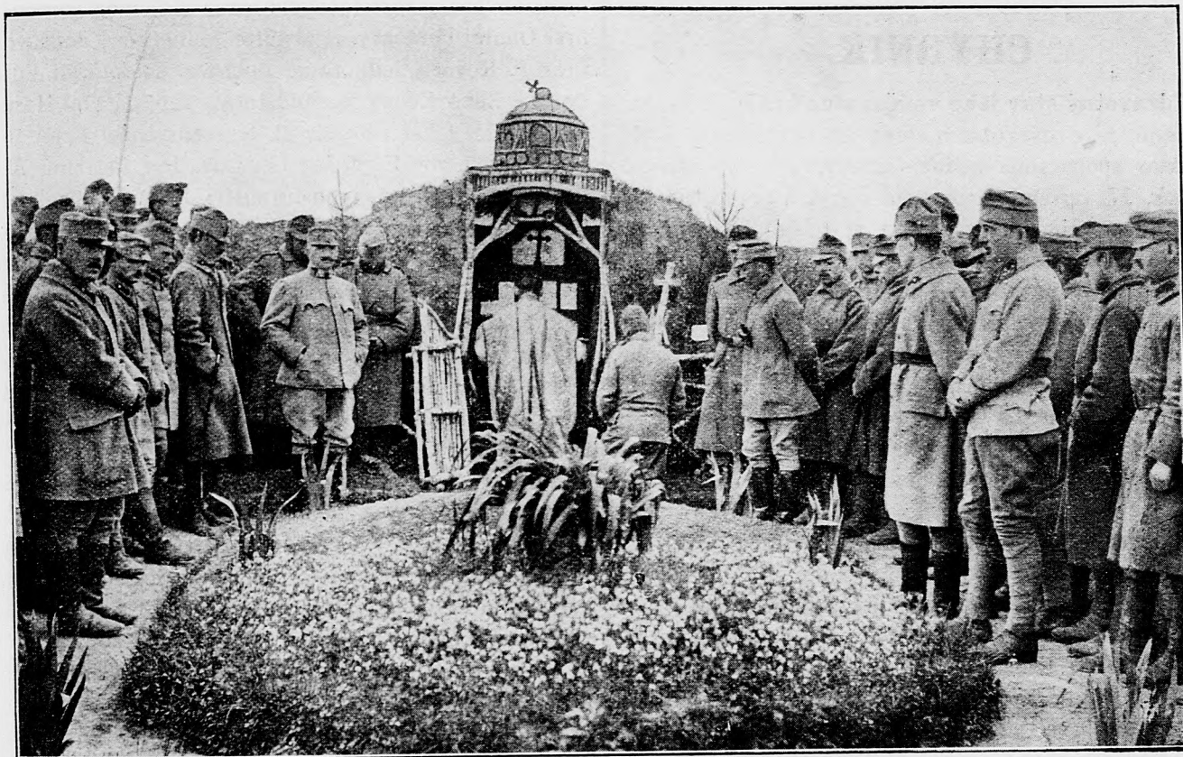
Sv. omša v káplne v strelnej zákope vystavenej.