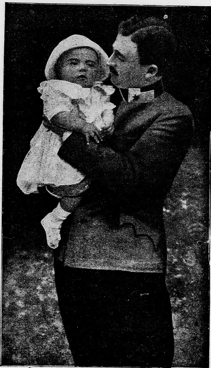
Kráľ Karol IV. s následníkom trónu.

V utorok predpoludním nemecký cisár Vilhelm prišiel do Viedne. Ačkoľvek prišiel incognito, obecnosť sa predsa dozvedlo o jeho prichode a vo veľkých zástupoch shromaždilo sa na ceste, ktorá vedie z Nordbahnhofu do Burgu. Kráľ Karol v uniforme pruského husárskeho generála išiel cisárovi v ústrety. Osobitý vlak cisára Vilhelma presne o 11. hodine zastal na nádraží. Nemecký cisár Vilhelm prišiel v rovnošate rakúsko-uhorského generála. Dvaja panovníci si stiskli ruky a