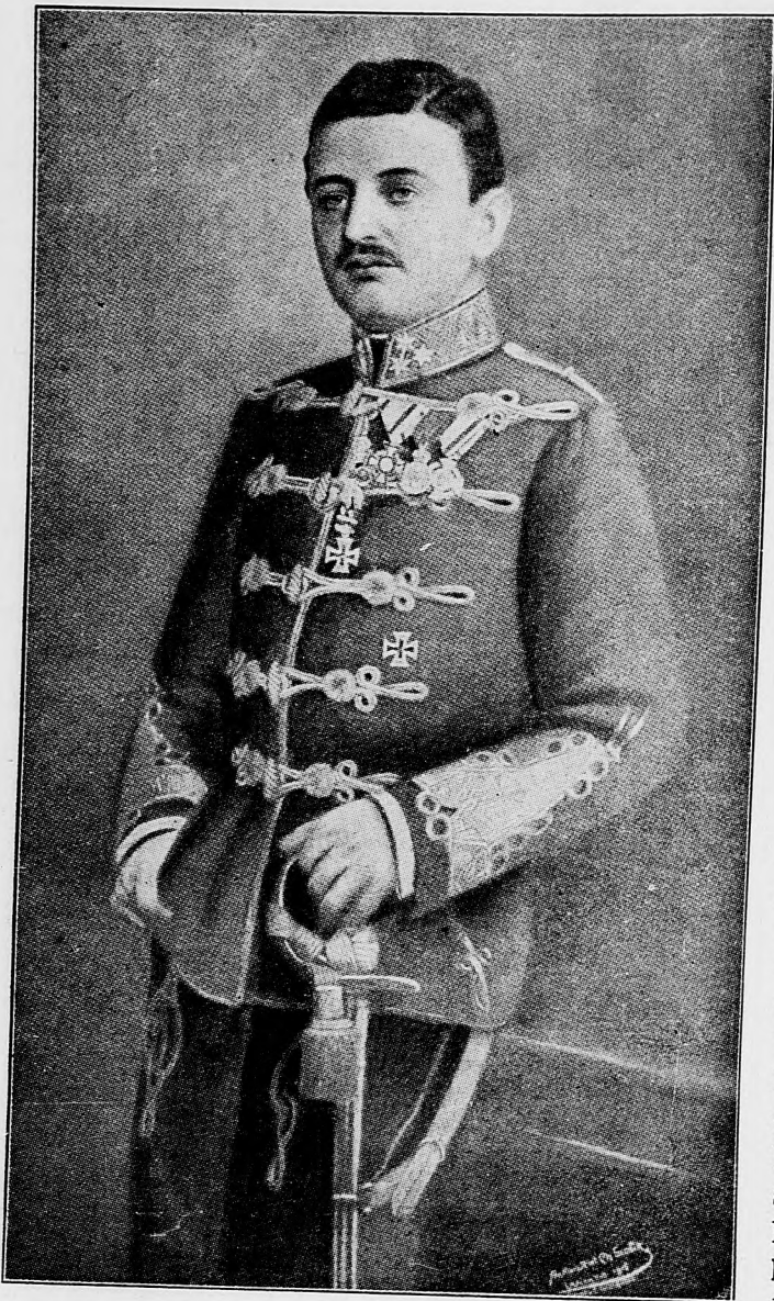
Kráľ Karol IV.

Odkedy ľudia žijú, poslednú vôľu mrtvých vždy považovali za svätú. V stupňovanej miere je nám svätou posledná vôľa na katafalku ležiaceho veľkého kráľa. Slubujeme vernosť, do smrti trvajúcu prítulnú lásku aj jeho následníkovi, jeho veličenstvu kráľovi Karolovi IV. Slubujeme ju s tou odhodlanosťou, ako naši predkovia ponukli svoj život a krv prababke najvyššej panovníckej rodiny Marii Terezii. Slubujeme ju tým s väčšou radosťou, bo náš nový kráľ v svojom prvom na národ upravenom ohlase vyznáva sa nielen za dediča trónu Franca Jozefa I., lež i za dediča jeho ducha. Chce sa čím skôr dať ozdobiť korunou sv. Štefana, aby podal svedectvo, že si ctí uhorskú ústavu a aby sa čím silnejšími sväzkami sviazal ku uhorskému národu. Keď teda holdujeme novému