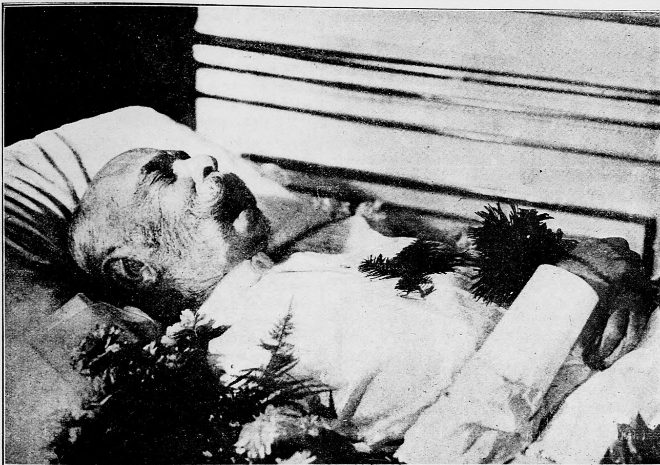
Jeho veličenstvo kráľ Franc Jozef I. na smrteľnej posteli.

Nie kráľovým, ani kráľovským, lež majetkom uhor-