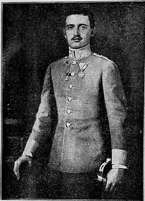
Jeho veličenstvo kráľ Karol IV.

Od 1. júla v bojoch pri Somme postavili do boja 104 francúzskych a anglických divízií, ktoré pritiahli z každého bodu frontu medzi morom a švajciarskou hranicou. Prevažná časť týchto divízií po krátkom od-dychu i druhý raz, ba i tretí a štvrtý raz vystúpila na fronte tak, že dovedna možno rátať, že útočilo 226 divízií. Francúzi v bitkách pri Somme do konca no-