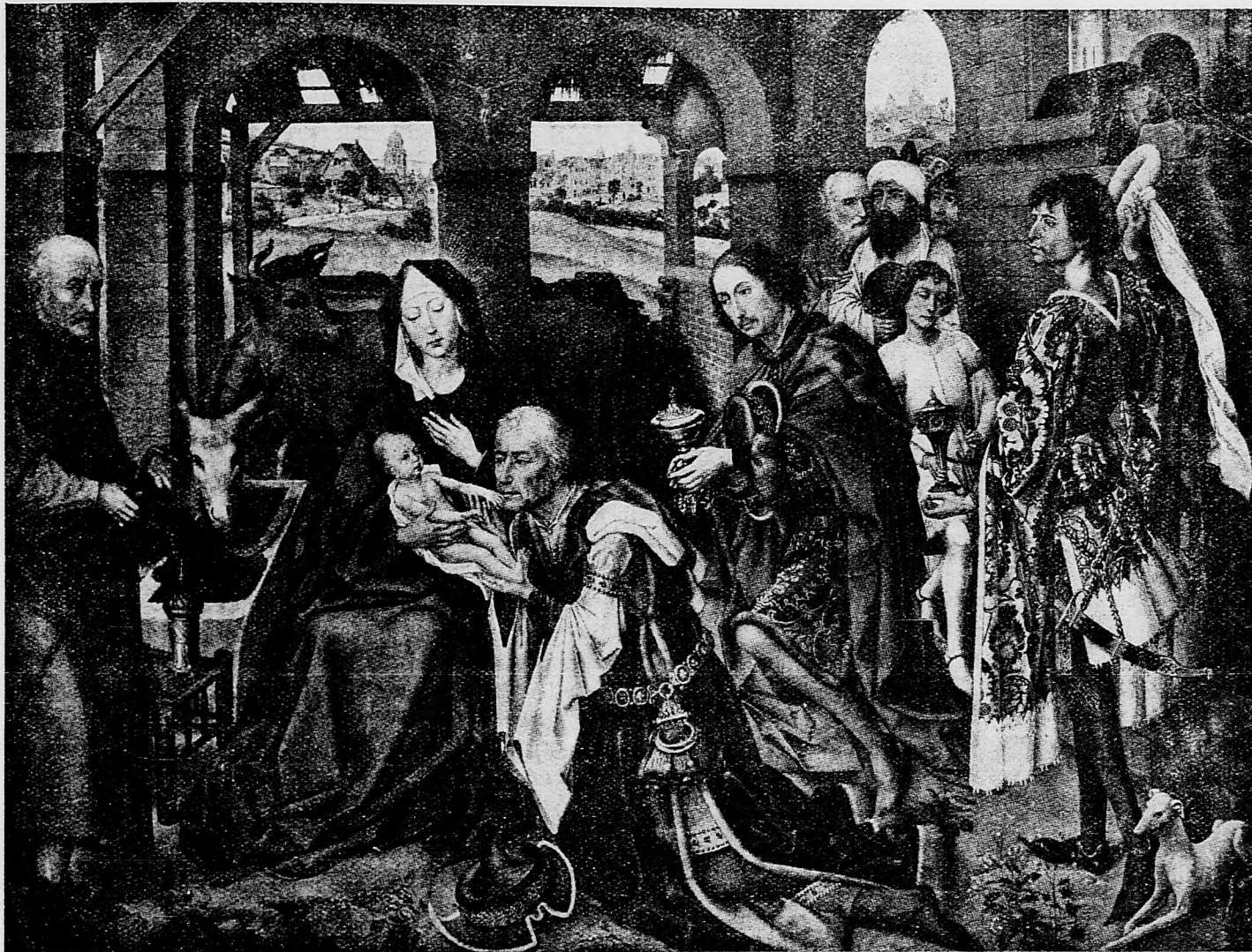
Poklona sv. Troch Kráľov.

— Nech žije kráľ! Nech žije kráľovná! Nech žije kráľovič! — znelo z tisícich hrdiel.