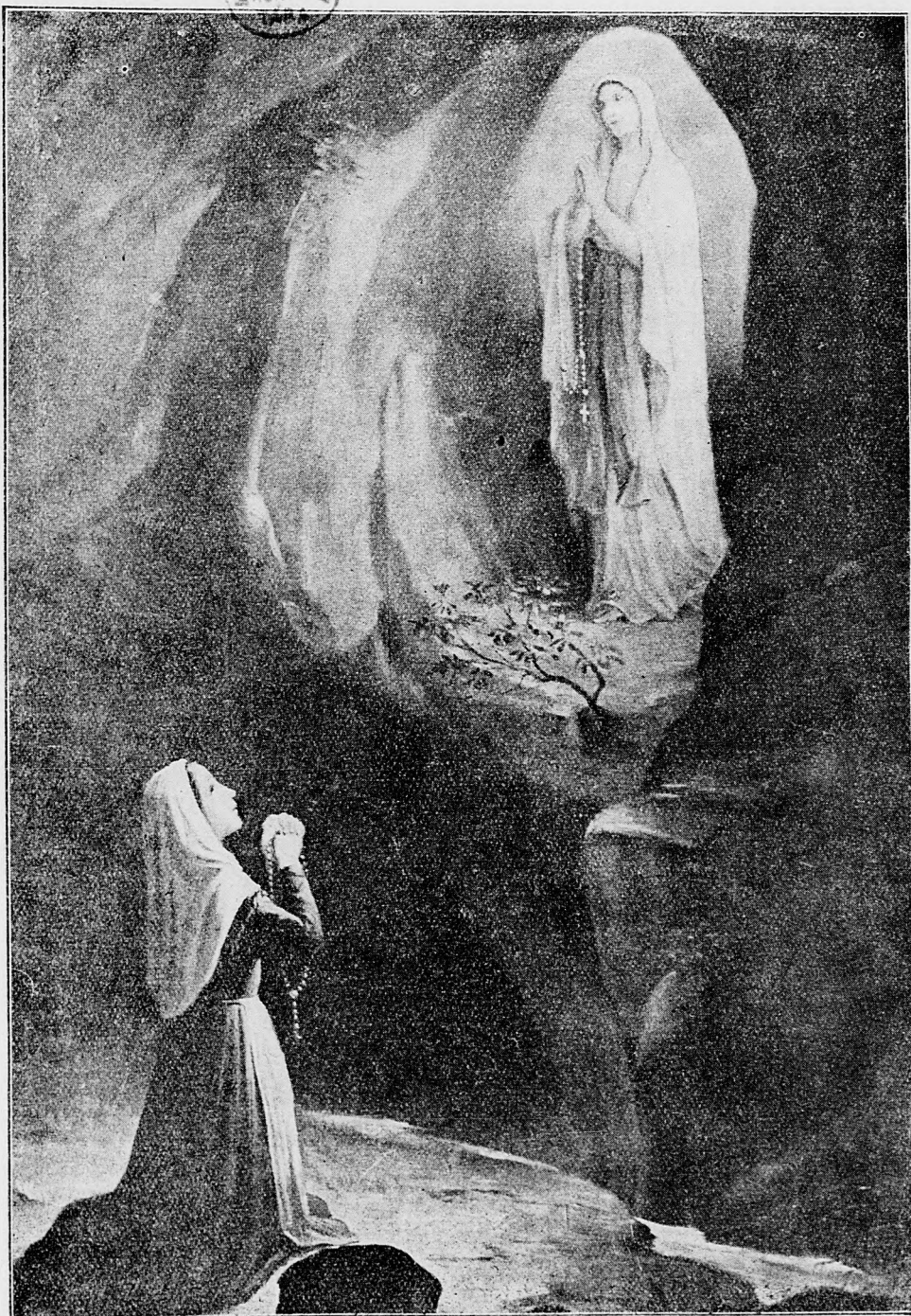
Zjavenie sa Panny Marie lurdskej.

Proti tomuto nešlachetnému zámeru, každého citu ľudskosti pozbavených nepriateľov, prinútení sme boli rozhodne zakročit'. Preto aj hlavné veliteľstvo Nemecka, spolu s naším hlavným veli-