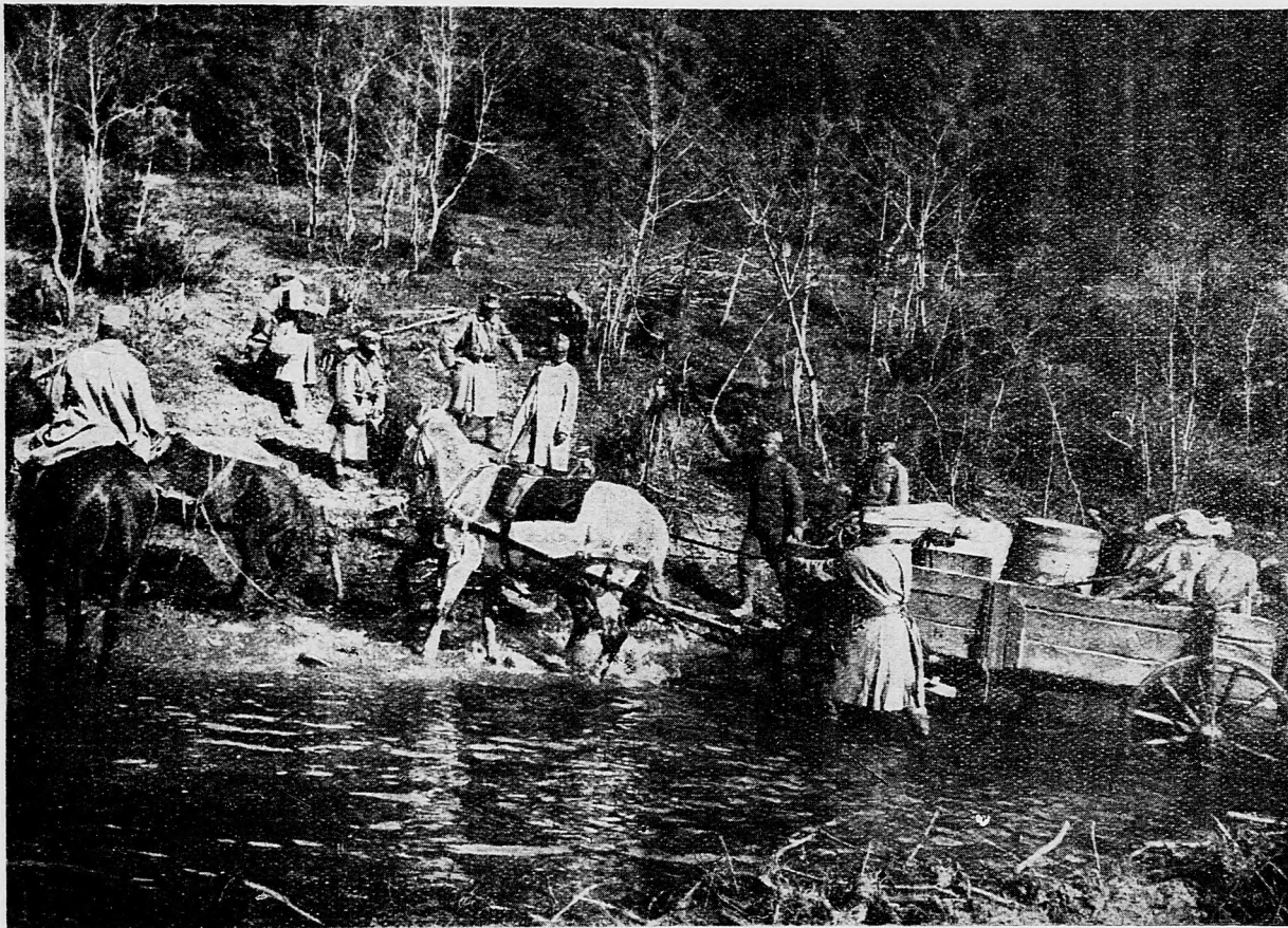
Muníciu vezú do našich posádí.

Veľmi mnoho škody zvykli narobiť v zime na ovocných stromoch aj poľní zajaci, bo zhryzú kôru mladých a starých stromov, čím prekazia riadne živenie sa stromu.