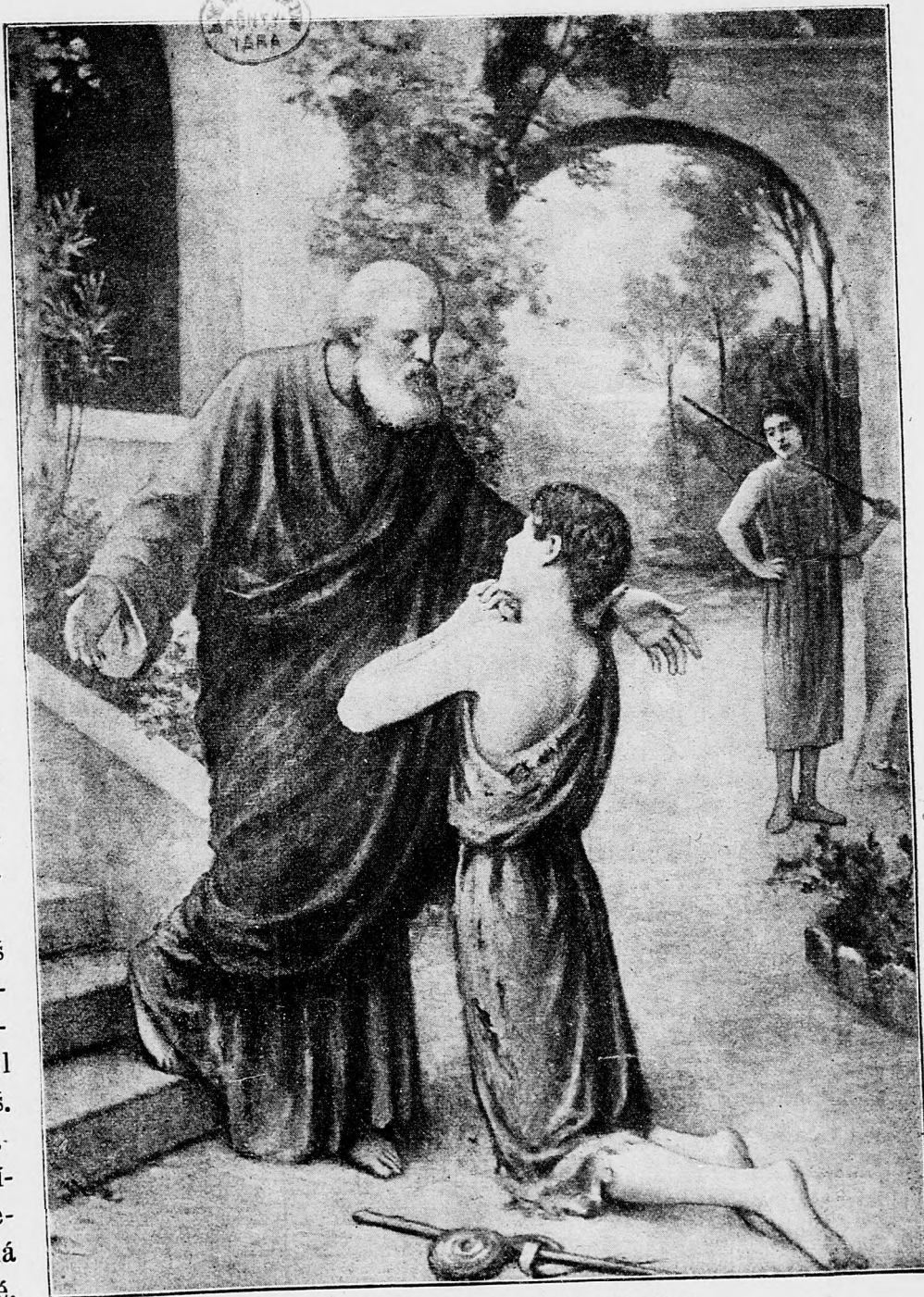
Marnotratný syn, príklad kajúcnikov.

— Milovaný Synu náš a Velební Bratia, pozdravenie a apoštolské pozhnanie. K potešeniu slúžil nám spoločný list váš. Každý riadok jeho prezraduje, že vaša k Nám prítulnosť a vo vedení sverených vám stád prejavená horlivosť duševná, sú také, aké najvyšší Pastier od