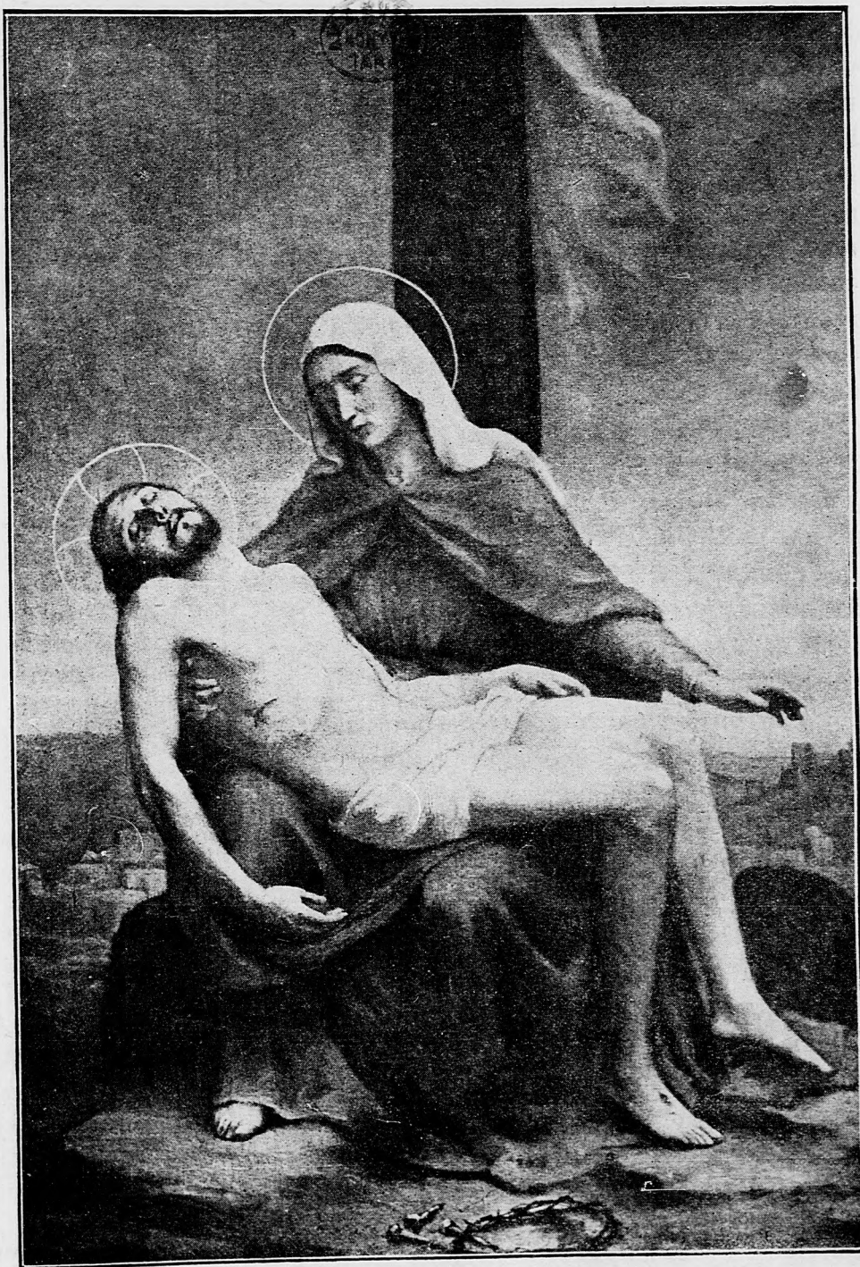
Sedmibolestná Panna Maria.

Ctená Snemovňa! Už od viac mesiacov v oprávnenej rozčúlenosti celú krajinu udržujú tie obžaloby, aké tlač, toto forum verejnosti, zdvihla proti parlamentu uhorskému. Je to záujmom tak opozície, ako aj väčšiny, aby auktorita a prestíža uhorského parlamentu obrátené boly tým