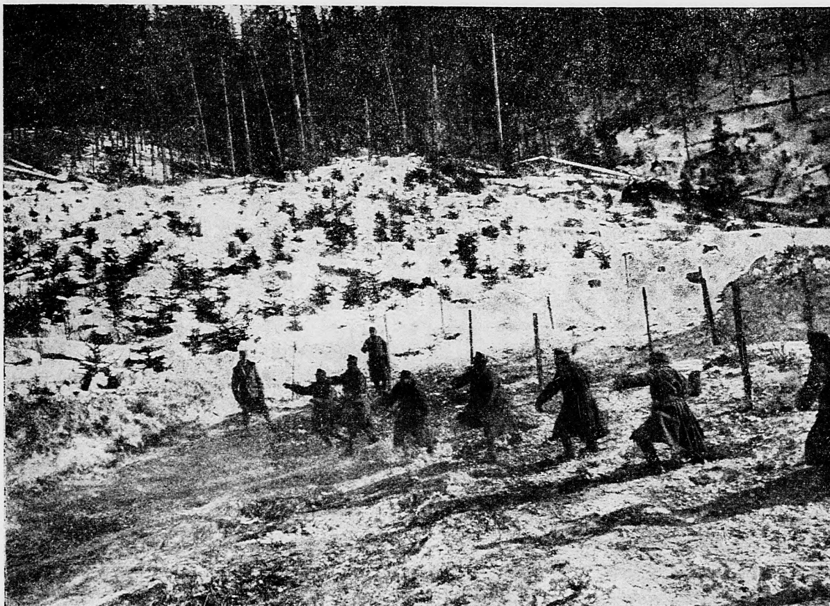
Útok s ručnými granátmi.

Uzavreli, že naskutku vstúpia do potyku s proletármi a s revolucionárnymi socialistami bojujúcich štátov a takto chcú zakončiť národom nanútené vojny.