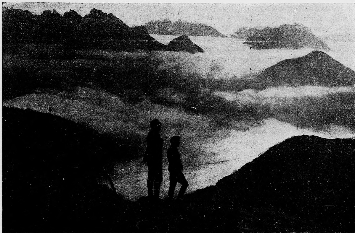
Medzi tyrolskými vrchami.

Rozpoviem, že pri bojuvaní čo máme ešte skončiť, čo máme smelo skončiť, aby náš boj nebol marný. Musíme nasbierať potravín nazbyt nielen pre nás, pre našu armádu a pre naše válečné námorníctvo, lež aj pre väčšinu tých národov, s ktorými nám je naša záležitosť spoločná a ku pomoci ktorých sa chytíme zbrane. Naše loďné fabriky musia dorábať stá a stá lodí, ktoré aj