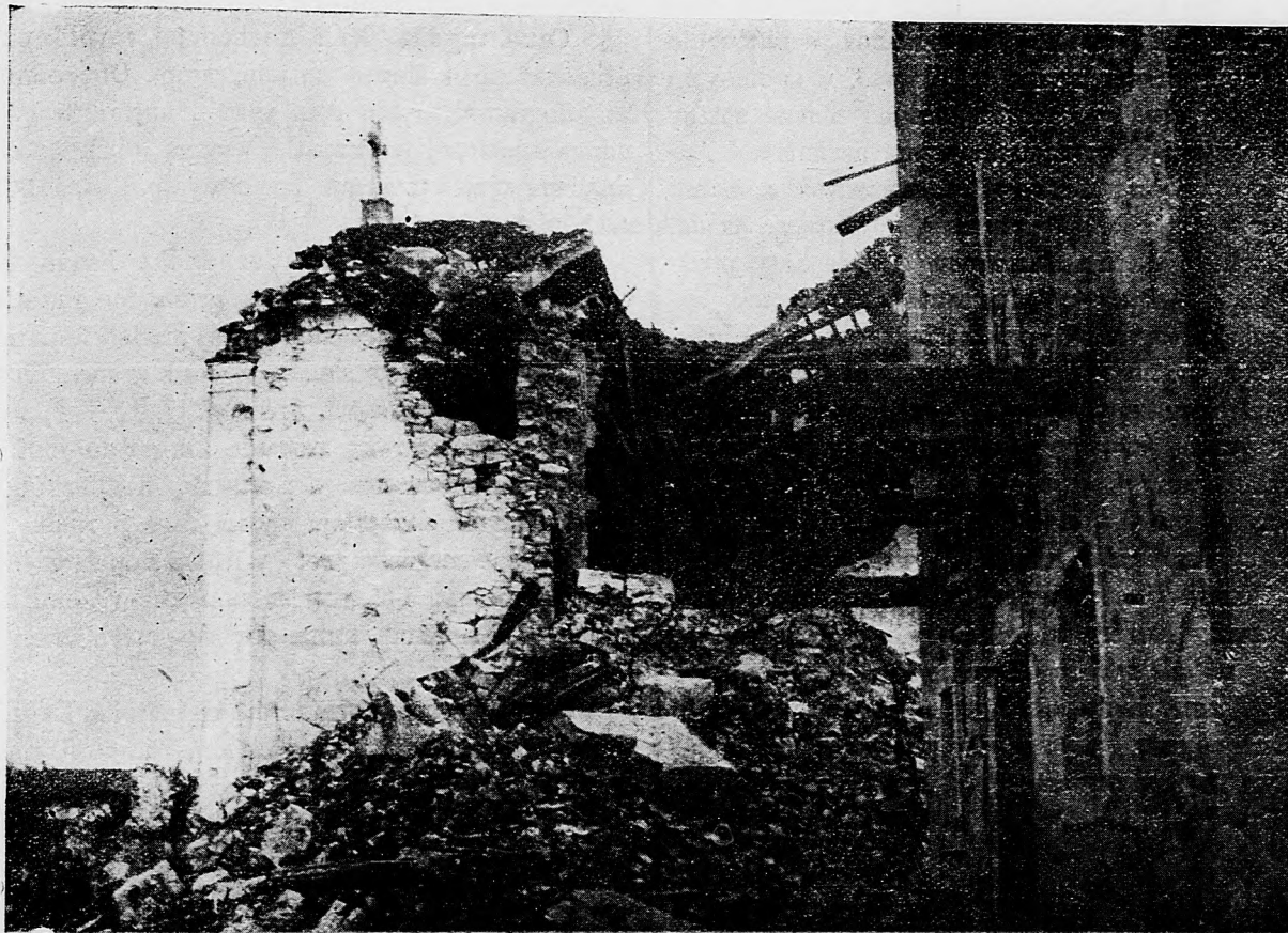
Talianmi rozstrieľaný doberdovský kostol.

Mimoriadne neobyčajné počasie v siatinách síce nezapríčinilo škody, ale žatva sa tohto roku predsa pozdejšie začne a preto nám zásoby obilia dlhšie musia vytrvať, ako sa myslelo. Krajinský stravovací úrad teda na základe najnovšieho nariadenia vlády ustanovil, aby všetky mlyny, ktoré majú smluvu s Válečnou plodinou speňajúcou účastinárskou spoločnosťou, od tohto času nasledovne zprísnil výmel: Múky na cesto majú do-